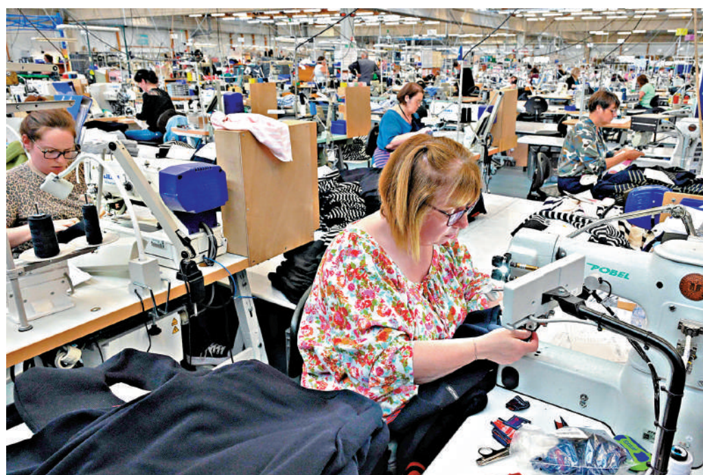
▶ 歐盟對美出口商品面臨新關稅。圖為工人在法國工廠生產用於出口的服裝。

美國總統特朗普12日宣布，將從8月1日起對從歐盟進口的商品徵收30%的關稅，並要求歐盟對美國商品「全面開放市場」以換取關稅下調。歐盟正努力與美國達成一項10%稅率的框架協議，並向特朗普「跪低」，放棄對蘋果等美國科企徵收數字稅。特朗普的關稅大棒此時突然砸向歐盟，令歐方感到錯愕。美媒披露，歐盟內部圍繞對美貿易談判產生分歧，為談判前景增加更多不確定性。