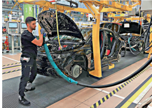
▶ 特朗普的汽車關稅對德國車企造成衝擊。

美媒表示，一名歐盟外交官日前樂觀地表示，在達成協議前，歐盟預計不會像日本、韓國、加拿大等美國盟友那樣，收到來自特朗普的關稅信函，但特朗普12日澆滅了這種樂觀情緒。馮德萊恩12日回應說，美方此舉將擾亂重要的跨大西洋供應鏈，歐盟將採取一切必要措施維護自身利益，包括在必