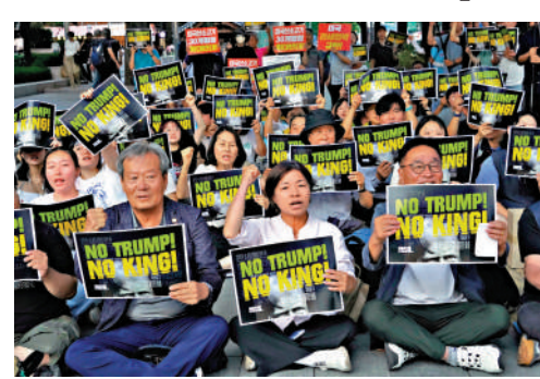
▲韓國民眾11日抗議特朗普的關稅政策。

的合作。韓國總統李在明向澳洲和德國派出特使，討論國防和貿易議題，並計劃向另外幾個國家派遣代表團。巴西和印度日前宣布，計劃在未來五年內將雙邊貿易額提升70%至200億美元。印度尼西亞表示，已接近與歐盟達成一項零關稅協議。亞洲社會政策研究所副總裁卡特勒表示：「隨著越來越多的國家感到難以滿足美國的要求，他們與其他貿易夥伴合作的興趣就會增強。」