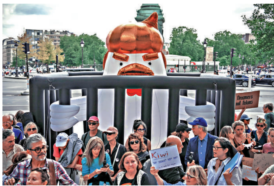
▲法國巴黎6月14日舉行反對特朗普關稅等政策的抗議活動。