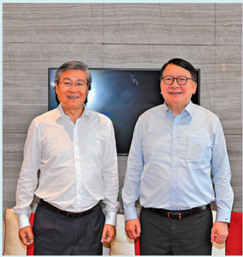
▲政務司司長陳國基14日在海口市與海南省政協黨組書記、主席李榮傑會面。