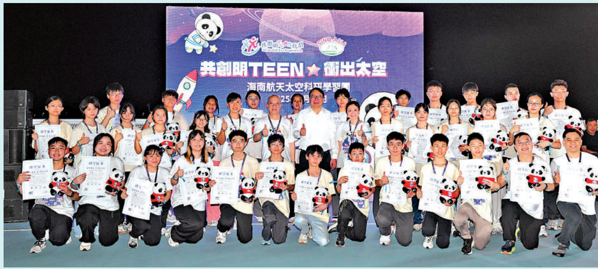
▲政務司司長陳國基昨日在海南省文昌遙光火箭發射觀禮平台參與「共創明Teen」計劃——海南航天太空研習團，一同觀看天舟九號升空。