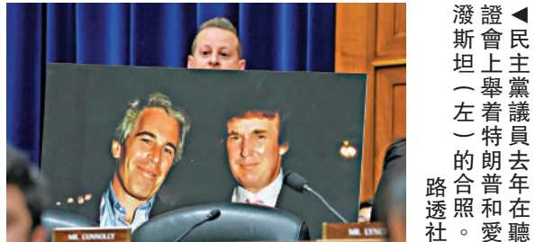
▲民主黨議員去年在聽證會上舉着「愛潑斯坦必須下台」的標語。

邦迪今年2月曾稱愛潑斯坦的「客戶名單就放在我的桌子上」等待審查。司法部和FBI此前發布的備忘錄內容卻180度轉彎，引發外界質疑。