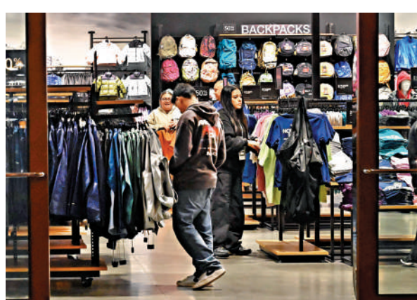
▲顧客在洛杉磯一間大賣場購買衣服。

特朗普15日在白宮回答記者相關提問時表示，美國「物價很低」，通脹率「非常低」，等同於「沒有通脹」，「我們在賺大錢」，美國徵收關稅是為了「讓錢進入美國」。