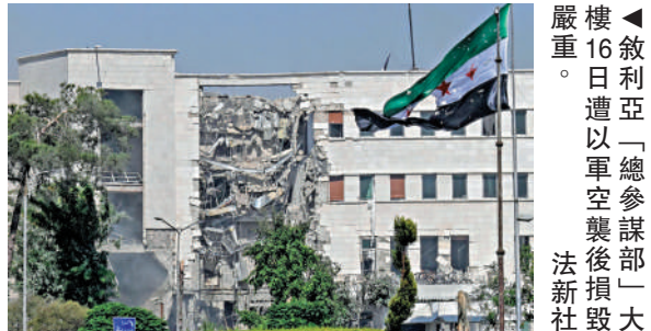
▲敘利亞遭「總參謀部」大樓空襲後，現場煙霧瀰漫。

此外，伊朗最高領袖哈梅內伊16日發表講話，稱以色列是一顆「毒瘤」，且受到美國支持。