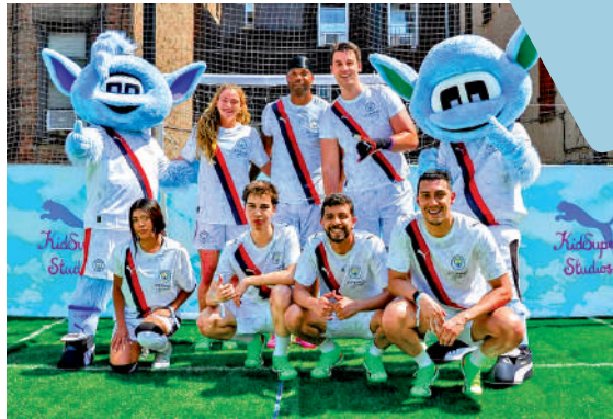
▲ 曼城早前宣傳球隊來季全新客球衣。

曼城與Puma原本的合約於2019年開始，為期10年、每年費用為6500萬鎊，如今曼城於周二宣布提早與Puma延長合約至2035年，而這份為期10年的新合約贊助費用總值高達10億鎊，平均每年費用達1億鎊（約10.2億港元），兩個數字俱打破曼聯於2023年與Adidas所簽下，總值9億鎊的10年合約紀錄，創下英超新高，較兩個爭標對手、阿仙奴與利物浦的現行球衣製造商合約亦高出一截。