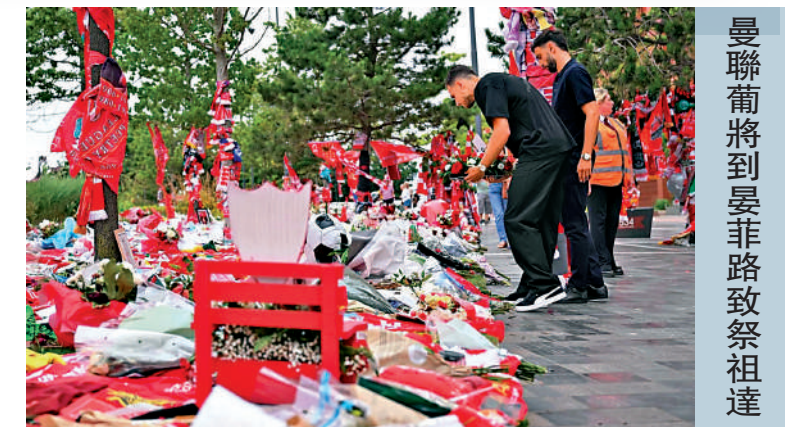
曼聯葡將到曼非路致祭祖達