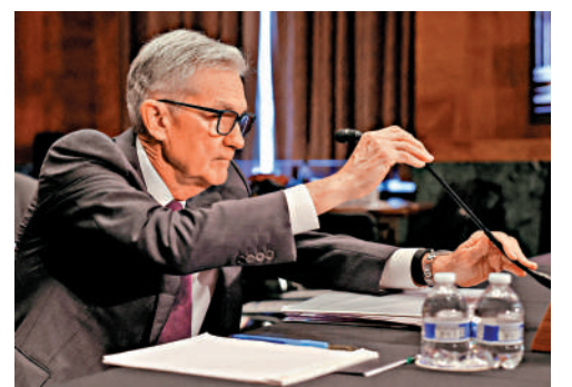
▲美聯儲主席鮑威爾今年6月出席眾議院聽證會。

幾個月來，特朗普一直催促美聯儲降息，但鮑威爾以關稅戰影響尚未完全顯現等為由拒絕配合。高盛、美國銀行、花旗集團、摩根大通的高管近日紛紛發聲，強調美聯儲不受白宮政治干預對美國經濟至關重要，解僱鮑威爾將影響金融市場穩定性。