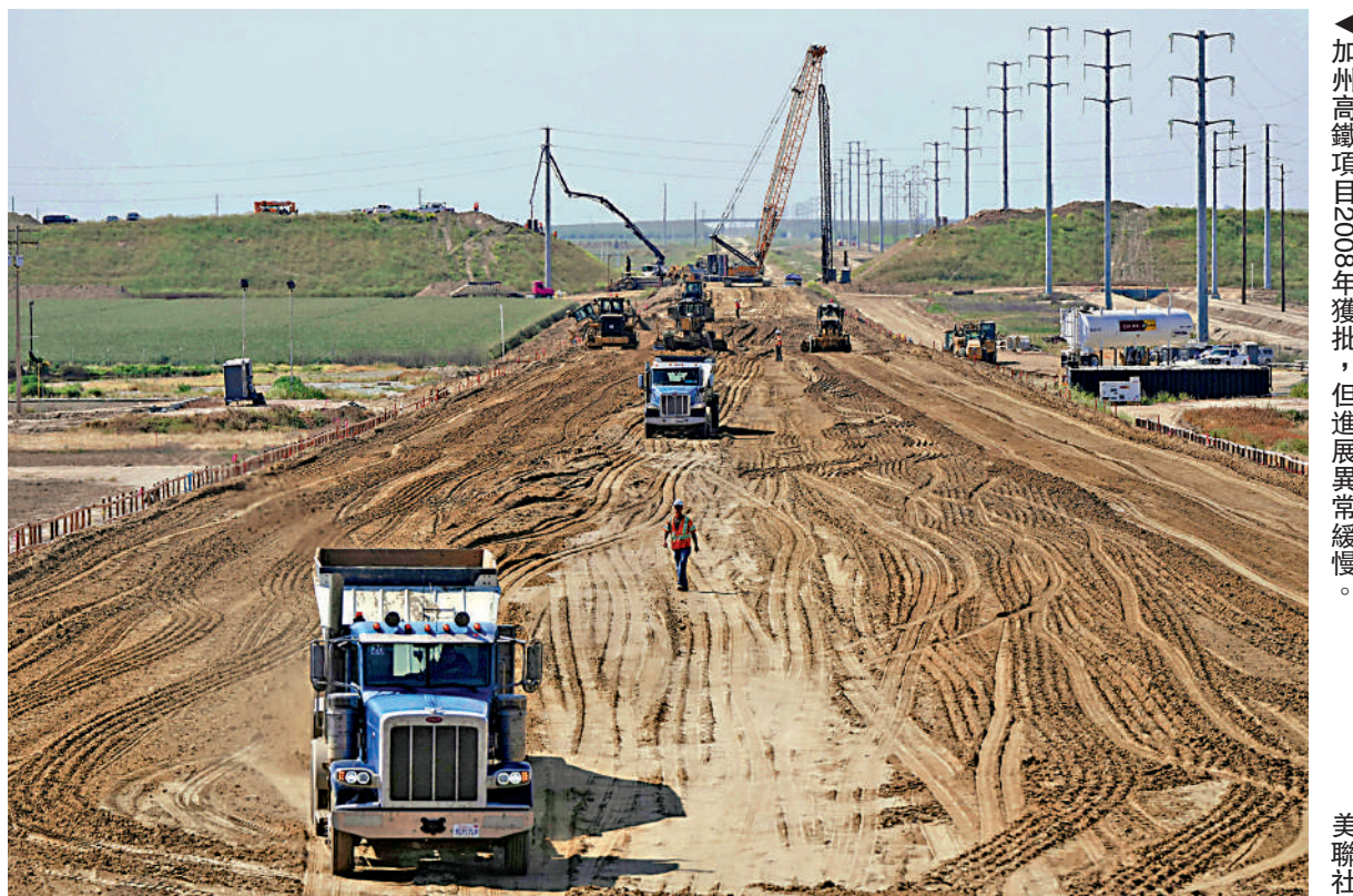
▲加州高鐵項目2008年獲批，但進展異常緩慢。