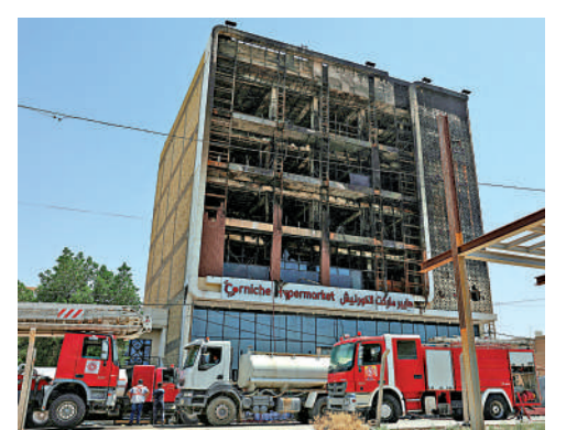
▲伊拉克一家超市16日夜間突發火災，超市所在大樓嚴重受損。路透社

邁希表示，瓦西特省當局已對大樓所有者、超市負責人以及所有相關責任人提起法律訴訟。