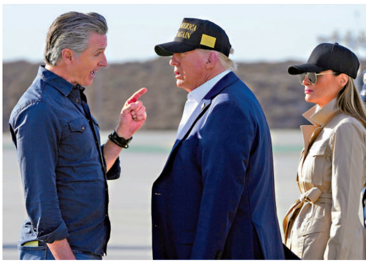
▲加州州長紐森（左）和特朗普（中）因高鐵項目矛盾升級。

美國總統特朗普16日宣布，取消對加州高鐵項目的40億美元（約312億港元）聯邦撥款，這個號稱「美國第一條真正的高鐵」的項目面臨爛尾風險。美國交通部長達菲稱，加州高鐵項目在17年間花費了160億美元（約1248億港元），卻連一條鐵軌都沒有鋪設，並指責加州州長、民主黨人紐森無能。該項目一直飽受工期拖延、成本超支困擾，如今又捲入黨爭。許多參與該項目的專家表示，未來10年內能通車的可能性微乎其微。