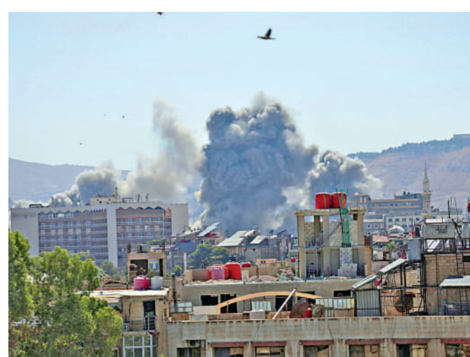
▲大馬士革16日遭以軍空襲。

敘利亞政權領導人艾哈邁德·沙拉17日指責以色列試圖將敘利亞拖入戰爭。13日，蘇韋達省德魯茲武裝派別和貝都因部落爆發激烈衝突，敘政權內政和國防部門武裝隨後介入並同一些德魯茲武裝派別發生交火。德魯茲人是分布在敘利亞、黎巴嫩、以色列和被佔領的戈蘭高地一帶的宗教少數群體。以色列以保護敘利亞德魯茲人和拒絕敘政權武裝進入敘南部為由進行軍事干預，14日起多次對敘利亞發動空襲。敘利亞政權16日宣布在蘇韋達省達成新的停火協議，敘國防部門武裝力量當晚開始撤出。