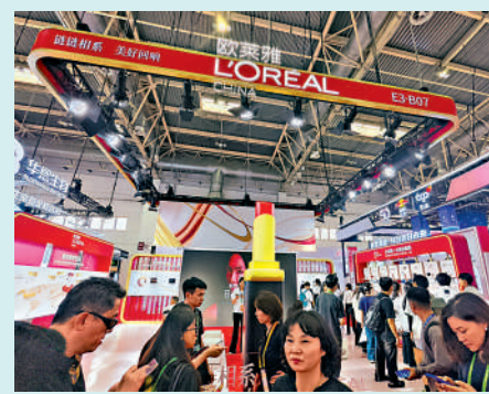
▲美妝巨頭歐萊雅展位人氣旺。