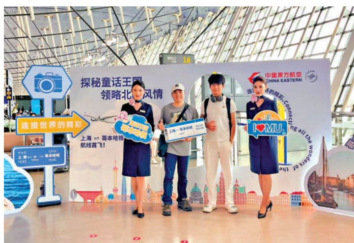
▲17日，東航「上海—哥本哈根」航線開通。