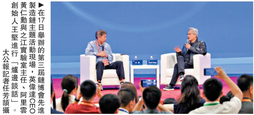
在17日舉行的第三屆鏈博會先進製造主題活動上，英偉達CEO黃仁勳與之江實驗室主任、阿里雲創始人王堅進行了一場「爐邊談話」。黃仁勳表示，AI在過去十多年時間裏，每隔三到五年就會有一次大變革，現階段AI已經能完成大部分認知性任務。他預測，人工智能的下一波發展將聚焦「物理人工智能」，即把推理能力應用於機器人等物理機械領域。

17日舉行的第三屆鏈博會先進製造主題活動上，英偉達CEO黃仁勳與之江實驗室主任、阿里雲創始人王堅進行了一場「爐邊談話」。黃仁勳表示，AI在過去十多年時間裏，每隔三到五年就會有一次大變革，現階段AI已經能完成大部分認知性任務。他預測，人工智能的下一波發展將聚焦「物理人工智能」，即把推理能力應用於機器人等物理機械領域。