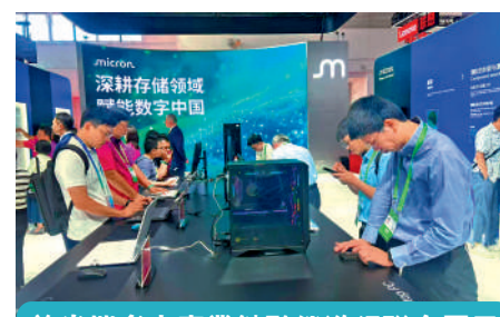
美光攜多家產業鏈夥伴進行聯合展示