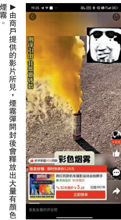
由商戶提供的影片所見，煙霧彈開封後會釋放出大量有顏色煙霧。