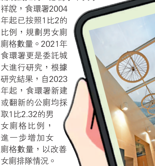
白石角公廁設計加入單車主題，並採用空氣淨化太陽能玻璃天幕。

不少地方的女廁經常大排長龍，本港公廁規劃如何回應需求？黃孝祥說，食環署2004年起已按照1比2的比例，規劃男女廁廁格數量。2021年食環署更是委託城大進行研究，根據研究結果，自2023年起，食環署新建或翻新的公廁均採取1比2.32的男女廁格比例，進一步增加女廁廁格數量，以改善女廁排隊情況。