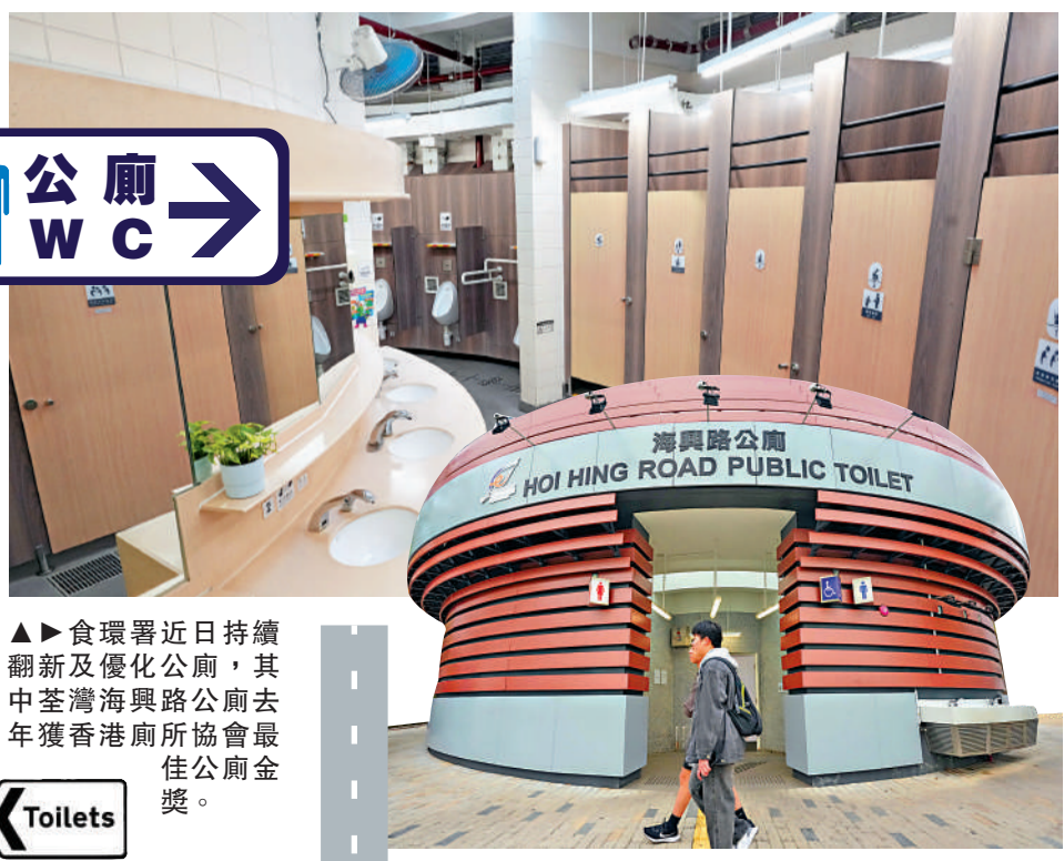
食環署近日持續翻新及優化公廁，其中荃灣海濱路公廁去年獲香港廁所協會最佳公廁金獎。

他又說，食環署會因應廁所的實際情況，調整翻新或優化工程的工作，包括外觀設計、翻新物料、通風系統、採光及照明，並加裝相應設施，包括在可行情況下，在位於主要旅遊景點或行山徑上的公廁外加裝飲水機等，滿足市民及遊客需要。