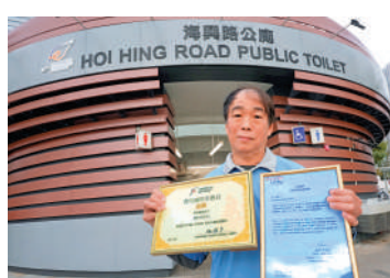
華哥為保持公廁清潔，每天勤力打掃，獲頒傑出廁所事務員金獎。

此外，為加快維修效率，食環署在各區使用「小型工程定單記錄系統」，清潔工人可透過手機應用程式，即時匯報維修項目，食環署去年透過該系統向建築署及機電署提出逾21000宗公廁維修要求，絕大部分要求於發現設施損壞的同日或翌日經系統提出，而建築署及機電署亦已在目標時間內完成逾九成的要求。