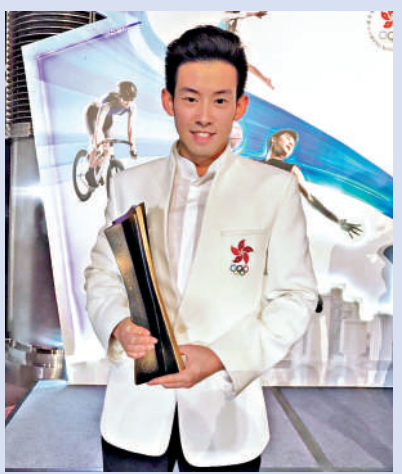
▲黃鎮廷曾經兩度奪得香港最佳運動員獎項。