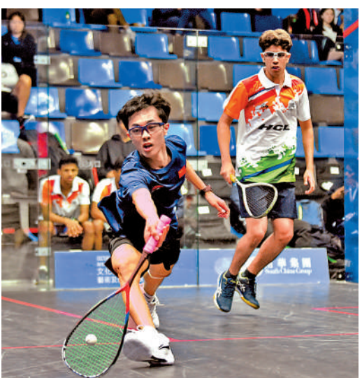
▲壁球對運動員的體能要求極高。資料圖片

接觸壁球，對技術的感覺越好。小球中心在備戰奧運會的同時，將在體校建設、俱樂部培養、校園推廣方面加強後備人才力量。」