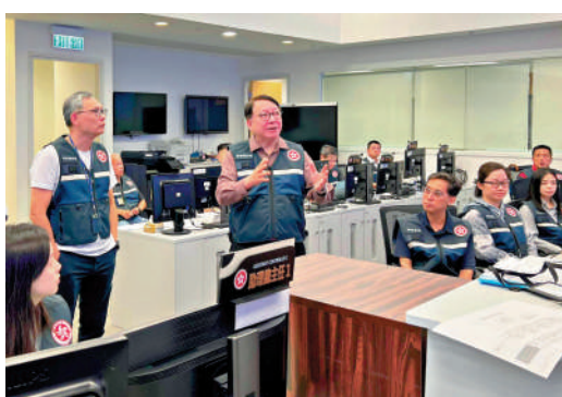
▲緊急事故監察及支援中心昨日投入運作，政務司司長陳國基到中心聽取「韋帕」最新動向及各項應變部署安排。

警管局表示，各醫院聯網已預留人手、食物及醫療物資，確保醫院服務運作正常；亦已加強視察公立醫院不同位置，包括可能出現水浸的黑點、渠道及樹木，以及提醒轄下各地盤工程的承建商，採取必