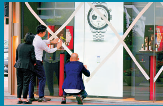
▲商戶為櫥窗貼膠紙防風球。