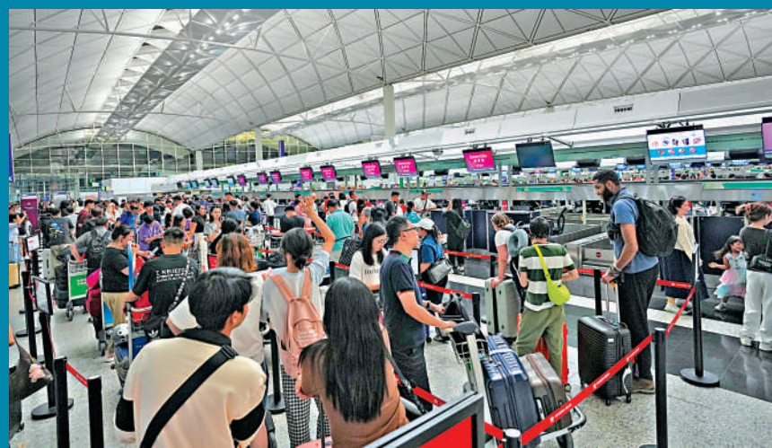
▲不少旅客昨晚趕在風暴吹襲前離港，機場人頭湧湧。