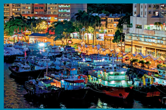
▲大批漁船駛入香港仔避風塘停泊。

會滯留機場。機場內有十多個間食肆及便利店會通宵營運，「機場會有免費WiFi讓公眾使用，除了本身的座位及餐廳外，機場亦會設立額外的臨時休息區，會有手機的充電設備及基本物資。」颱風期間，機場會有過千名員工通宵當值確保運作暢順，旅客關顧組主動接觸旅客派發乾糧、食水和物資。大公報記者 伍軒沛