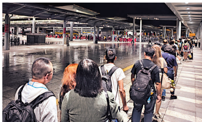
▲昨晚十時半，數以千計市民在澳門關口排隊候車，趕在港珠澳大橋封橋前回香港。

城巴預計今日由頭班車起至中午前，除個別連接口岸及機場路線維持有限度服務外，大部分路線不提供服務。新界專線小巴9A號線（北潭涌—萬宜水庫東壩）暫停服務至另行通知。