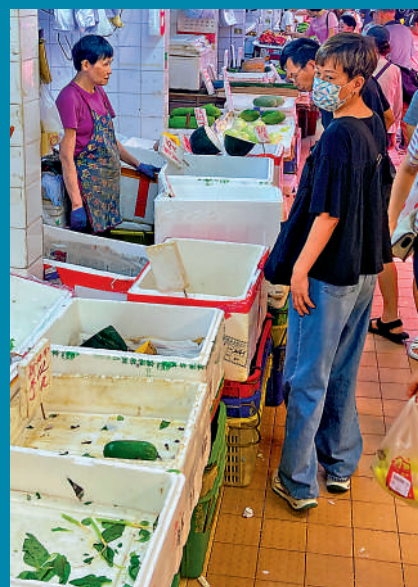
▲在黃大仙大成街市，蔬菜幾乎被買光。