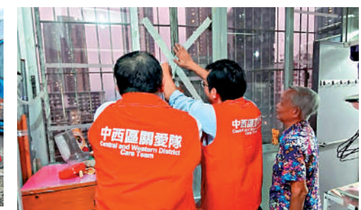
▲關愛隊為長者住戶的窗戶貼膠紙防風。