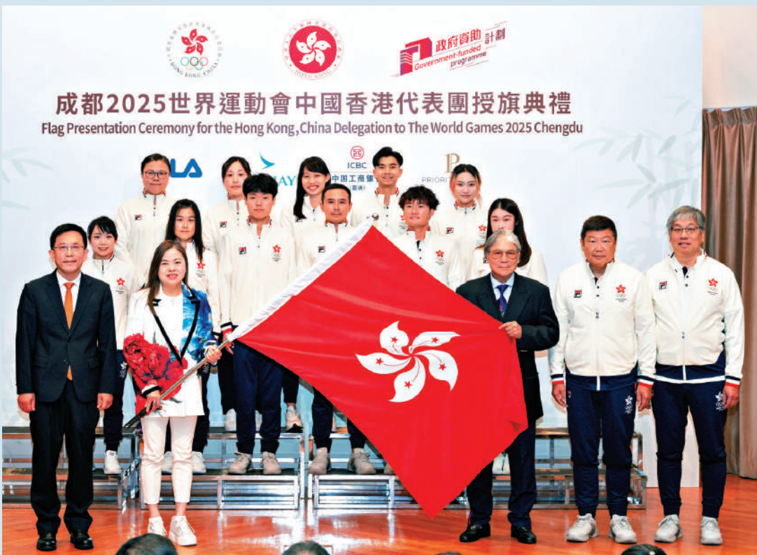
▲世運會中國香港代表團授旗儀式昨舉行。