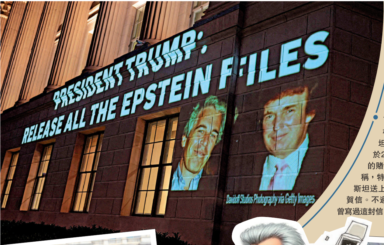
▲美國商務部大樓外牆18日被投影特朗普與愛潑斯坦的合照，呼籲特朗普公開更多信息。

美媒注意到，《華爾街日報》的爆料似乎讓四分五裂的MAGA陣營暫時重新團結起來。此前批評特朗普政府的右翼人士紛紛調轉槍口，抨擊《華爾街日報》及其老闆梅鐸。前白宮高級顧問班農聲稱，MAGA支持者看到了共同的敵人，即所謂「深層政府」及其媒體夥伴。然而，這種態勢能否持續尚待觀察，特別是在特朗普要求公布的大陪審團證詞難以滿足MAGA陣營需求的情況下。（綜合報道）