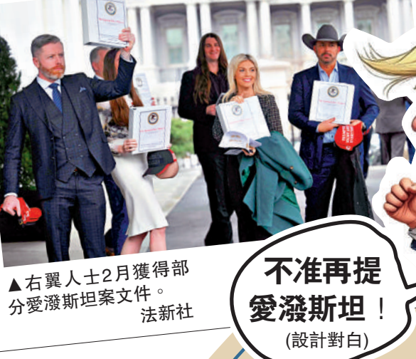
▲右翼人士2月獲得部分愛潑斯坦案文件。不准再提愛潑斯坦！（設計對白）