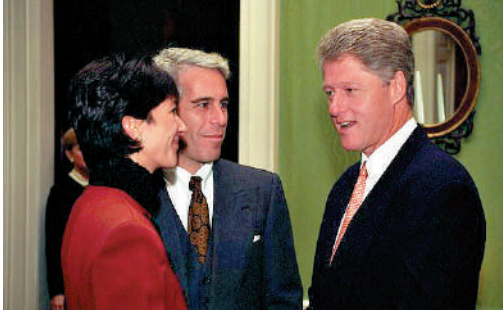
▲克林頓（右一）1993年在白宮與愛潑斯坦及麥克斯韋爾交談。資料圖片

件，受害人舍貝里在證詞中提到，愛潑斯坦曾談到克林頓，並透露他喜歡「年輕女孩」。舍貝里還說，她知道愛潑斯坦和克林頓之間有「交易」。克林頓的發言人則稱，克林頓對愛潑斯坦的罪行「毫不知情」。