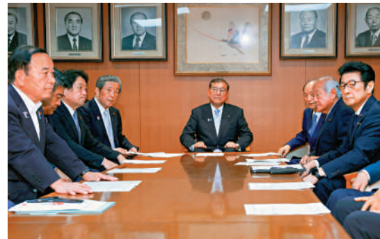
▲石破茂（中）堅持留任，引起自民黨議員不滿。

共同社21日至22日實施的輿論調查顯示，石破茂內閣的支持率降至22.9%，跌至去年10月內閣上台以來的最低點；不支持率則大幅上升至65.8%。逾半數受訪者認為石破茂應該對參議院選舉結果負責並辭職。