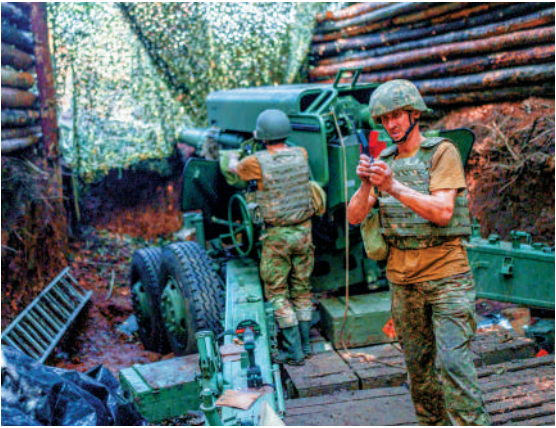
▲烏克蘭士兵19日在哈爾科夫地區與俄軍交戰。

【大公報訊】綜合美國廣播公司、塔斯社報道：當地時間21日晚，烏克蘭總統澤連斯基表示，俄烏雙方代表團將於23日在土耳其伊斯坦布爾再次碰面，討論如何結束俄烏衝突。俄媒援引消息人士稱，俄烏第三輪談判將於24日舉行，雙方代表團可能於23日抵達伊斯坦布爾。俄總統新聞秘書佩斯科夫表示，沒有理由期待新一輪談判