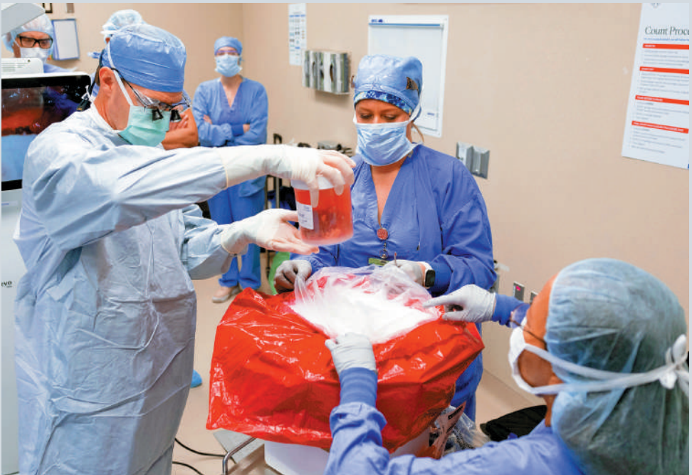
▲美國的捐贈器官供不應求，導致違規操作屢見不鮮。