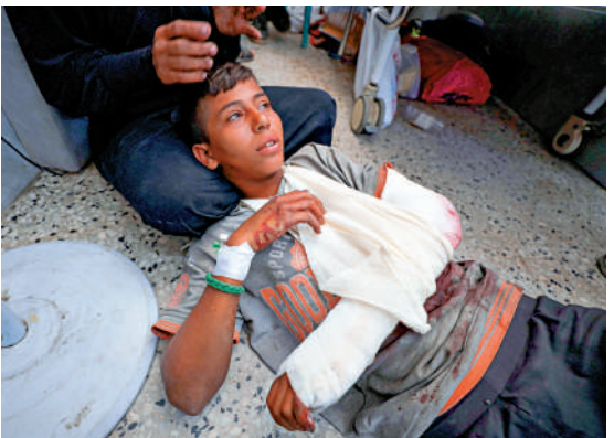
▲一名加沙兒童22日在以軍空襲中受傷。