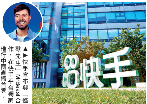
MrBeast在快手平台獨家進行中國直播首秀。

【大公報訊】儘管歌手周杰倫的「周同學」過檔抖音，短視頻平台快手（01024）隨即找來美國播主MrBeast（圖）「補位」，並預告本週六（26日）進行直播首秀，消息刺激快手股價抽高7%。 快手宣布與「怪獸先生」MrBeast合作，在快手平台獨家進行中國直播首秀，7月26日中午12時首播。