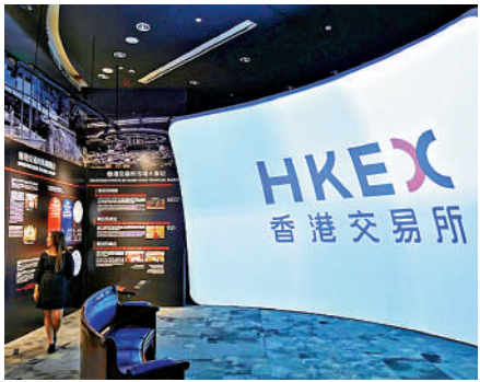
▲港股成交暢旺，港交所業績被看好。

次季料多賺32% 香港新股市場上半年勢頭強勁，根據數據供應商Dealogic的統計，期內香港新股融資額達到141億美元，按年增長6.95倍，遠超全球新股融資額的8%增幅。同時，港交所指出，上半年投資者情緒回暖，同時大量優質公司通過香港市場籌集資金，推動香港股權融資市場大幅增長。儘管全球地緣政治環境仍然複雜，恒生指數期內領跑全球，上漲超過20%，港股平均每日成交金額按年增長82%，至2400億元。 受惠於股市大熱，料港交所將有不俗業績表現。摩根士丹利預計，港交所第二季日均成交額或按年激增95%至2380億元，但按季微跌2%，反映市場對貿易關稅的擔憂。此外，衍生產品日均成交額按年微跌1%。另指，儘管利率顯著下降，由於保證金要求提高帶動資金規模擴大，該行估計淨投資收入將按季增長8%。