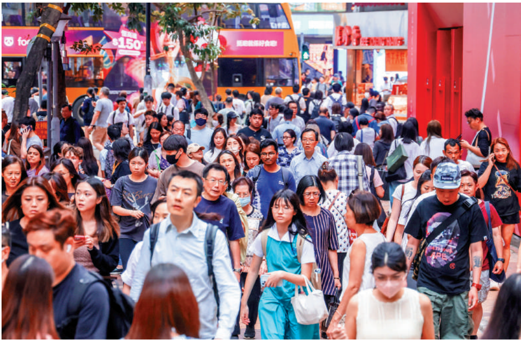
▲二〇二四年六月至今，特區政府多項輸入人才計劃共接獲逾十九萬宗申請，當中近十四萬宗獲批。

立法會議員葛珮帆問及各項人才入境計劃獲批來港的申請人中，從事創新科技範疇的人數，孫玉菡回覆，「一般就業政策」及「輸入內地人才計劃」下分別約7.6萬及5.7萬宗獲批申請中，從事創新科技（創科）相關範疇工作的獲批申請人數目分別為1654及4006；優才計劃下，過去三年成功通過甄選程序的獲批個案約有2.7萬宗，當中8021名申請人背景來自創科相關範疇；「科技人才入境計劃」過去三