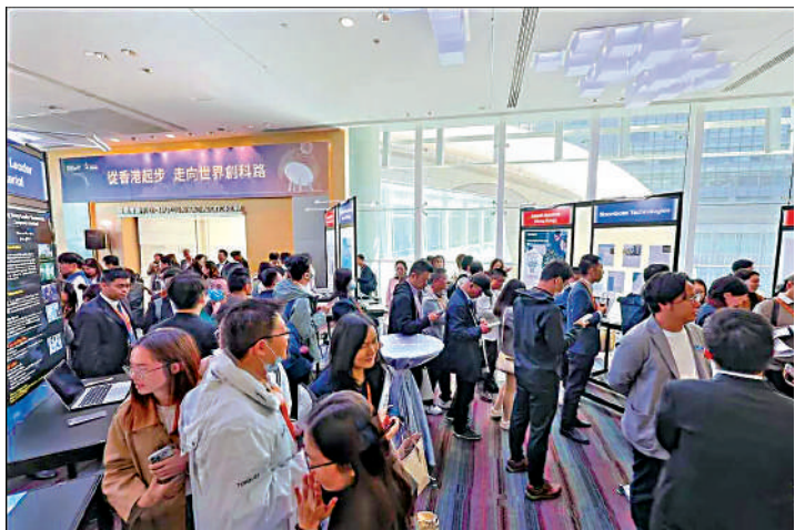
▲高才通引入的人才約兩成從事創科行業。圖為科技園公司過往舉辦創科高才招聘會。

孫玉菡指出，為應對目前全球教育格局變化，教育局已呼籲全港所有大學為受影響的學者提供便利措施，維護他們的正當合法權益。面對美國局勢，如何支援本地大學吸引海外頂尖科學家來港發展，孫玉菡回覆，除設置配對資助外，國際頂尖學者、科學家和科研人員可按其情況透過合適的人才入境計劃申請來港，無需再另設人才入境計劃。