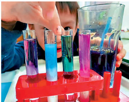
▲有議員關注當局會否為校外機構的STEAM課程制訂認證制度。

【大公報訊】記者戴東報道：近日有家長帶子女到校外機構參加STEAM興趣班時，意外被滾燙牛奶燙傷，有立法會議員關注當局會否就制訂安全管理規範，以及為校外STEAM課程設立教師、教材及課程的認證制度。教育局局長蔡若蓮表示，當局無意為非正規課程的私立學校所舉辦的STEAM課程設立認證制度。