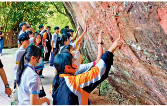
▲學生參與考察交流團或會遇上不同問題，教育局強調，設有恆常機制保障學生安全。

蔡若蓮表示，有關事故發生後，教育局已即時要求承辦機構停用涉事餐廳，並要求為交流和考察團提供膳食的餐廳暫停供應生冷食品和貝類海鮮，教育局亦隨即成立學生內地考察專責小組，定期安排與內地部門和單位聯繫，並與承辦機構加強突發事件的通報機制。她指出，各交流和考察團已經順利完成行程並回港。