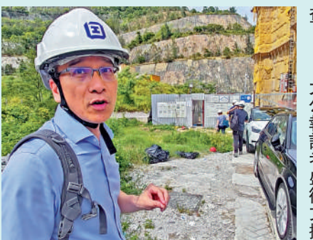
▲勞工處昨日中午派多人到安達臣道長實首置盤進行調查。