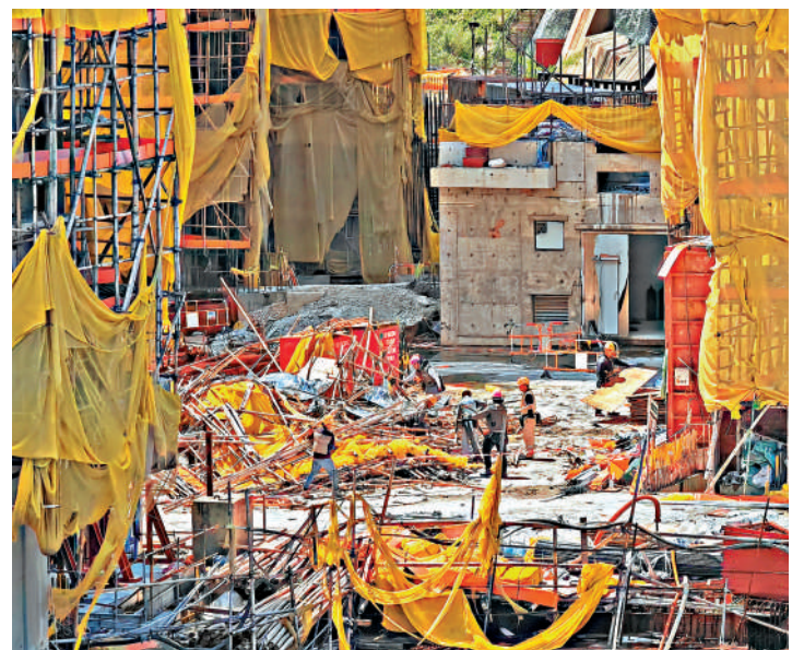
▲地盤工人在清理拆下來的棚架等物件。