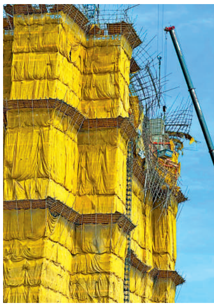
▲安達臣道長實首置盤涉違規作業，用垃圾斗吊工人上高空拆棚架。