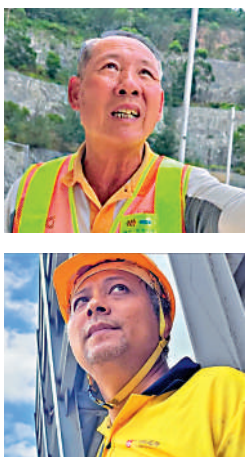
▲安達臣道有地盤工友洪先生(上)及何先生(下)目擊事件，齊斥承建商嚴重忽視工人安全。