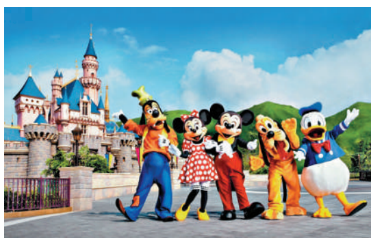
▲迪士尼計劃推出演唱會與樂園門票套票，吸引旅客留港過夜。