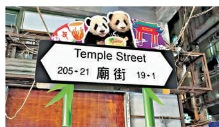
市熊二 民貓條 旅主 者街 客題 一陸 集路 郵續 聯換， 廣上 邀大 十

香港旅遊促進會總幹事崔定邦向大公報記者說，海洋公園持續推出聯乘活動，包括現時正在跟韓國的LINE FRIENDS合作，在園內推出主題活動，緊接加推聯乘Labubu，持續提供新鮮感，方向非常正確，要吸引旅客到訪，香港旅遊業必須持續推陳出新，配合正在舉行的足球盛事和大型演唱會，吸引更多旅客過夜，預期今個暑假訪港旅客人數，將會跟去年持平或更好。