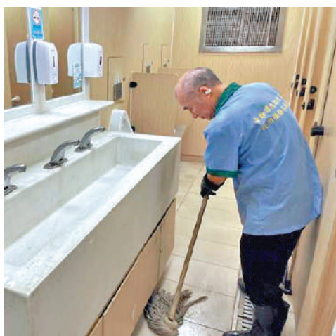
園街市公廁的清潔工作。後，當局即時跟進加緊相關問題。