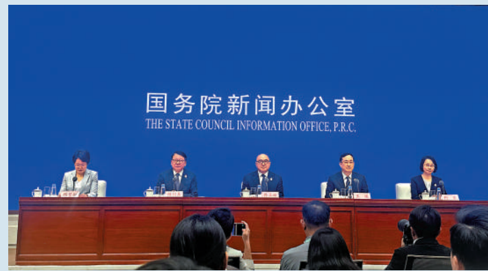
▲國新辦昨日舉行發布會，介紹今屆全運會籌辦情況。