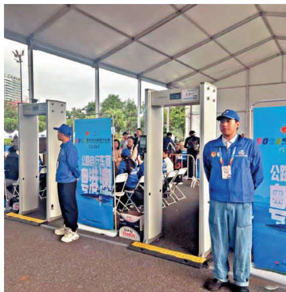
▲粵港澳三地借助科技力量，確保通關實現「零延時、零接觸、零等待」。

據悉，今屆全運將於11月9日在廣州開幕，11月21日在深圳閉幕。競體比賽項目設34個大項419個小項，其中57個小項在開幕前完成，預計1.5萬餘名運動員參加決賽。群眾賽事活動設23個大項166個小項，其中148個小項在開幕前完成，預計約有1.1萬名運動員參加決賽。