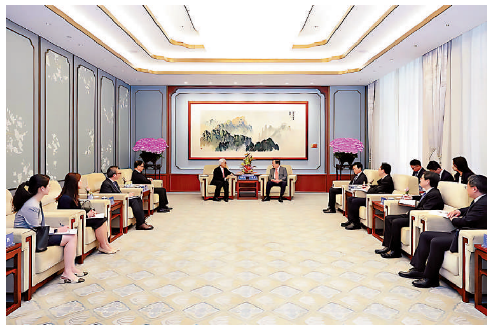
夏寶龍在北京會見香港保監局主席姚建華、行政總監張雲正一行。