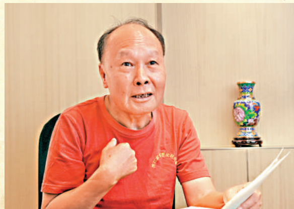
▲程前表示，秘密電台遺址現時只剩斷壁殘垣，但它見證了游擊隊員的英勇機智，更銘刻了游擊隊及村民的赤膽忠誠。