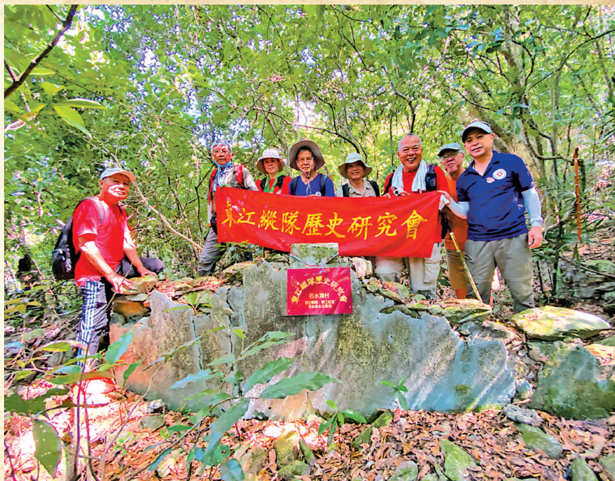
▲2022年10月，考據隊梳理前人線索，結合地理定位與現地勘察資料，終成功尋找到廣東人民抗日游擊總隊東江縱隊歷史研究會提供。