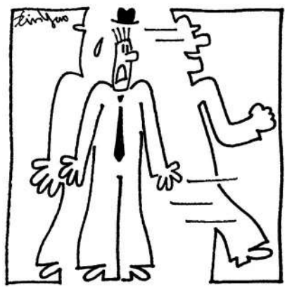
懂得怎樣解決問題的人，工作效率永遠趕不上懂得怎樣避開問題的人。