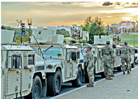
►美國國民警衛隊12日進駐華盛頓。

五角大樓11日晚表示，已有約800名國民警衛隊隊員部署至華盛頓，其中100至200人將直接支援執法行動。12日，有目擊者看到國民警衛隊隊員在政府建築外設置路障。白宮新聞秘書萊維特說，聯邦執法人員