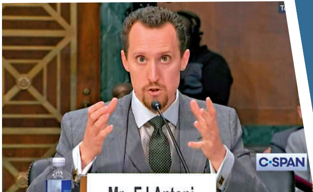
▲保守派經濟學家安東尼獲提名出任勞工統計局局長。網絡圖片

【大公報訊】特朗普11日提名保守派智庫傳統基金會聯邦預算中心首席經濟學家安東尼，出任美國勞工統計局局長。安東尼4日接受霍士新聞採訪時曾批評勞工統計局的統計方式，並表示該局應暫停發布月度就業報告，僅發布季度數據。這一建議引發強烈爭議，美媒表示，此舉「史無前例」，將導致公眾與市場失去了解經濟健康狀況的重要信息來源。