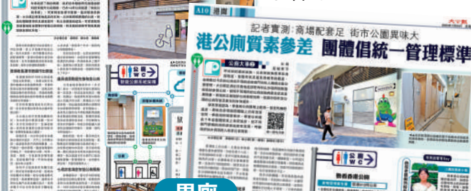
▲大公報早前刊登的《公廁大事》系列，引起社會關注。

大公報早前刊登的《公廁大事》系列，走訪多區公廁，探討不同場所的公廁設施與衛生狀況，由於公廁質素參差，有團體建議統一管理標準，有立法會議員認為，可在景點等高流量地區全面推行智能公廁系統，民生區的廁所可聚焦基礎設施自動化升級。