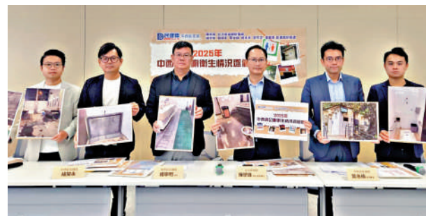
▲民建聯建議，政府改善抽風系統，加派人手巡查公廁狀況，加強監管外判承建商。

最差女廁，位於西營盤海旁的中山紀念公園女廁，僅得29分，地面同樣非常濕滑，而且有異味。