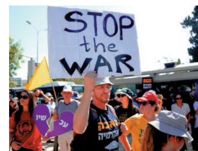
▲8月17日，以色列民眾在耶路撒冷參加抗議活動，要求以色列政府結束戰爭。

出以色列會在當地時間17日恢復批准向加沙運送帳篷及其他避難物的物資，以便在以軍展開接管加沙城的軍事行動前讓當地平民往南撤離。哈馬斯回應稱，以色列聲稱將在加沙地帶南部設置帳篷和其他避難設施，此舉就是「公然欺騙」，以色列的計劃將對當地人構成「新一波種族滅絕」，並導致他們流離失所。