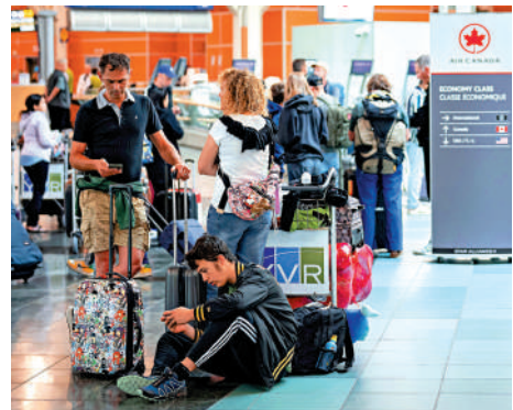
▲受加拿大航空空乘人員罷工影響，許多旅客16日滯留在溫哥華國際機場。