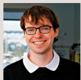
▲ AI研究員戴特克被朱克伯格高薪挖角。網絡圖片