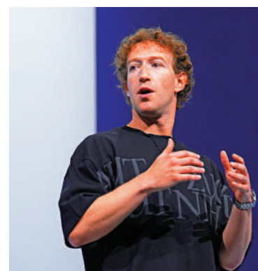
▲ Meta創始人朱克伯格。

對投資人而言，Meta的豪賭也帶來了巨大的不確定性。高盛等機構的分析師認為，要讓全行業高達萬億美元的AI投資獲得合理回報，AI技術必須能夠解決極其複雜的問題，但目前的生成式AI似乎並未被設計用於此，其成本下降速度也可能不及預期。（綜合報道）