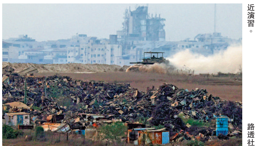
▲8月16日，一輛以色列坦克在加沙沙地帶。路透社附

據悉，加拿大勞資關係委員會還下令將工會與加航之間於3月31日到期的集體協議條款延長，直至達成新的協議。