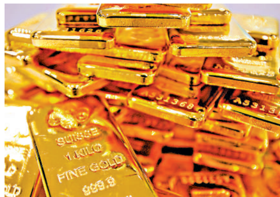
為特區政府正致力推動香港發展成為國際黃金交易中心。

另一個正在積極推動的領域是跨國供應鏈管理中心。陳茂波表示，隨着全球供應鏈和貿易的重塑和整合，加上內地產業自身的升級轉型，以及國家高水平雙向對外開放的發展戰略，大量內地企業正加快部署「出海」，包括在「全球南方」和「一帶一路」地區佈置產業鏈和供應鏈。他認為，對於這些「出海」企業來說，香港國際資金匯聚和自由進出、金融服務蓬勃和全鏈條、機場和港口高效通達全球，貿易網絡匯聚了全球的