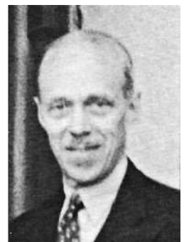
▶ 美國傳教士，將馬吉影像送出南京。