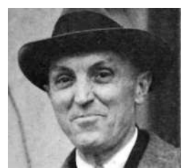
▶ 美國牧師，馬吉影像拍攝者。