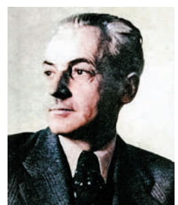
▶ 英國記者，與費奇一道剪輯、製作影像。