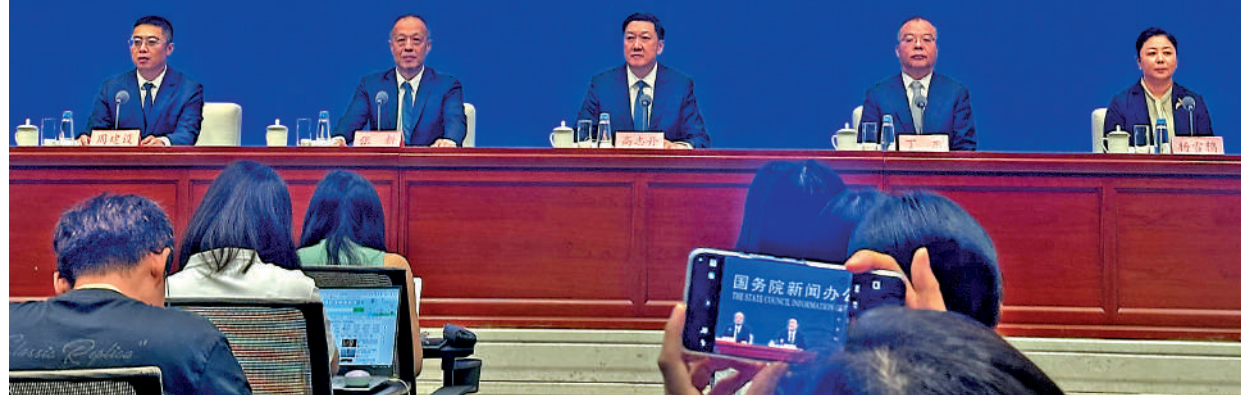
▲國新辦昨在北京舉行「高質量完成『十四五』規劃」系列主題新聞發布會。

THE STATE COUNCIL INFORMATION OFFICE, P.R.C.