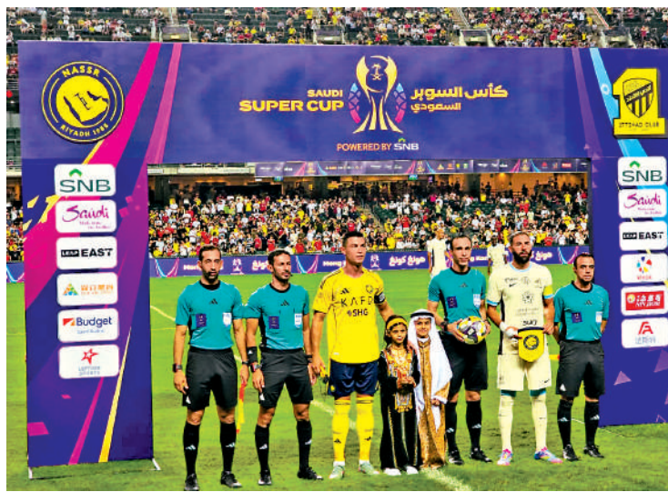
C朗拿度（左三）在賽前與球證等合照。