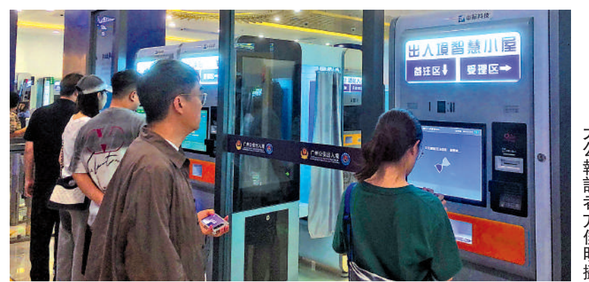
▲出入境智慧小屋融合「拍照、指紋採集對比、繳費、即簽即走」多項功能為一體。