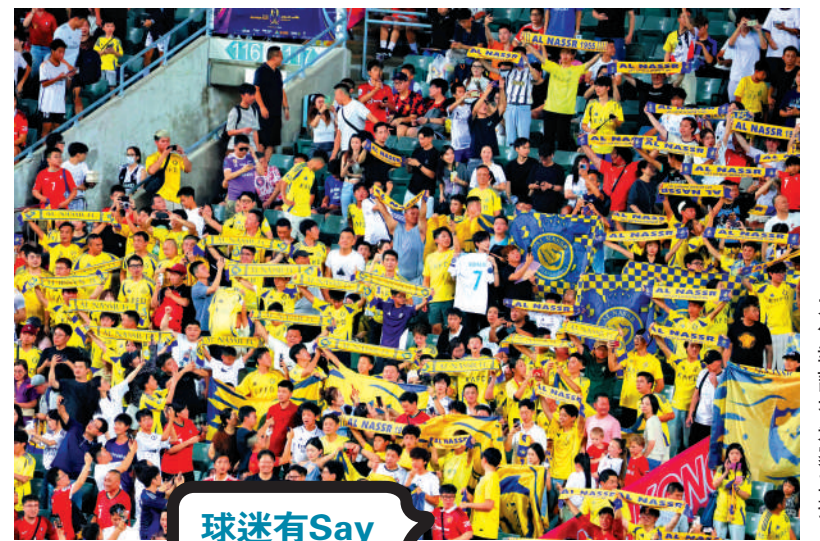
艾納斯球迷全力打氣。