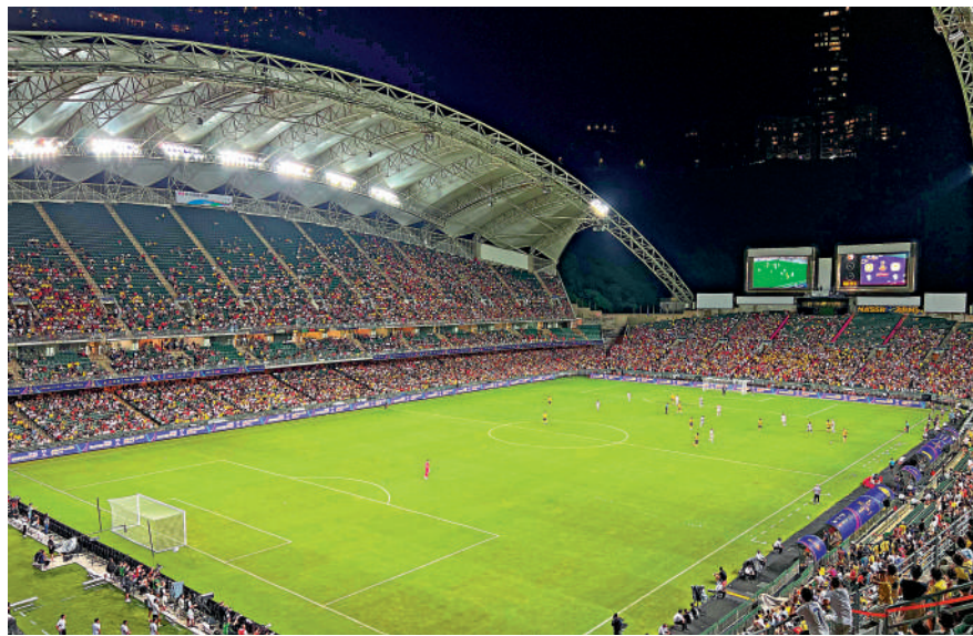
昨仗吸引30653名球迷入場。