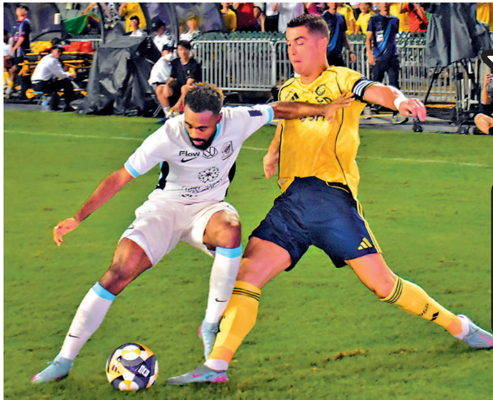
C朗拿度（右）在比賽中與對手力爭皮球。

雖然本屆沙超盃移師香港大球場舉行，但仍吸引不少艾納斯的沙特阿拉伯球迷遠道來港觀賽。約有數十人的沙特球迷在北看台掛起橫幅及拿起球隊旗幟，不斷高喊「艾納斯加油」，並配以沙特本土的傳統鼓聲，一度成為大球場最為突出的焦點。在艾納斯球員出場時，球迷更報以響徹全場的掌聲，場面十分震撼。