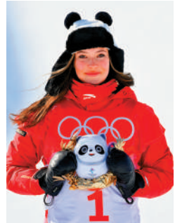
▲谷愛凌在2022年北京冬奧會奪得兩金。

【大公報訊】記者蘇雨潤北京報導：19日，國務院新聞辦公室在北京舉行「高質量完成『十四五』規劃」系列主題新聞發布會，介紹「十四五」時期體育強國建設成就。國家體育總局局長高志丹在會上表示，截至2024年底，「十四五」時期，中國體育健兒共取得519個世界冠軍，創世界紀錄68次。其中，北京冬奧會實現參賽成績歷史性突破，巴黎奧運