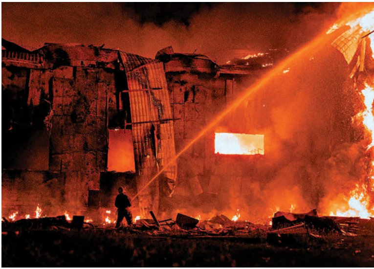
▲ 俄烏衝突持續，圖為烏克蘭蘇梅地區18日遭空襲。