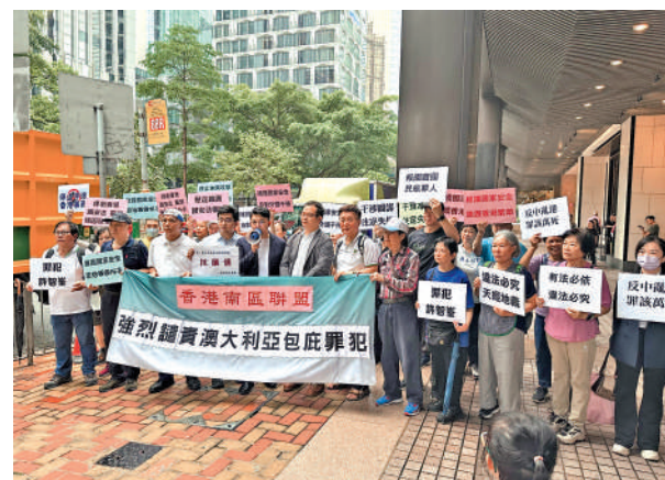
團體要求澳洲政府認清現實，切實尊重法治精神。

是任何一個法治社會都不能容忍、不能容許的。另一市民團體指，這些被通緝的反中亂港分子，在香港修例風波期間，做出嚴重危害國家安全的行為，之後畏罪潛逃至英國。在海外，他們繼續肆無忌