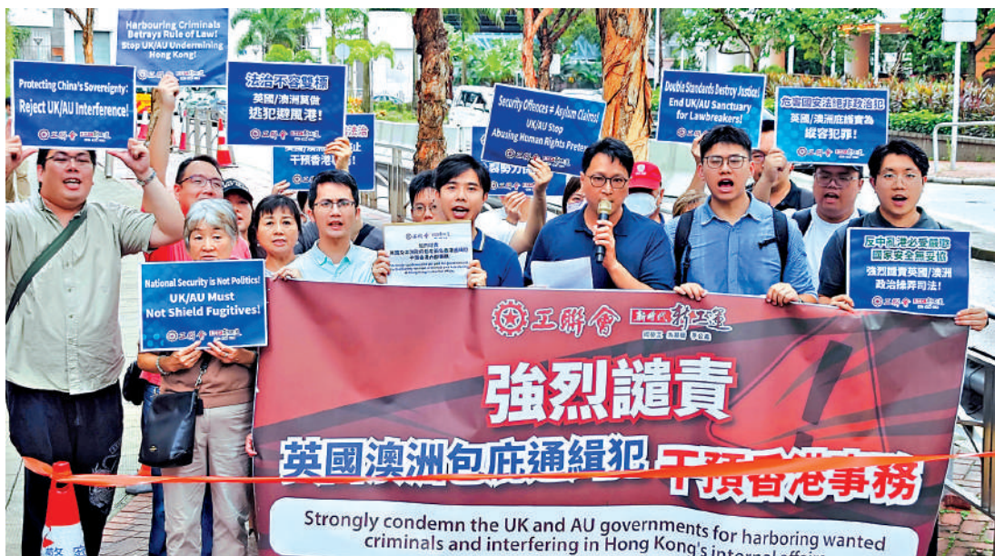
多個團體昨日分別到英國和澳洲駐港領事館抗議，強烈譴責兩國政府包庇兩名香港通緝犯，干預香港內部事務。