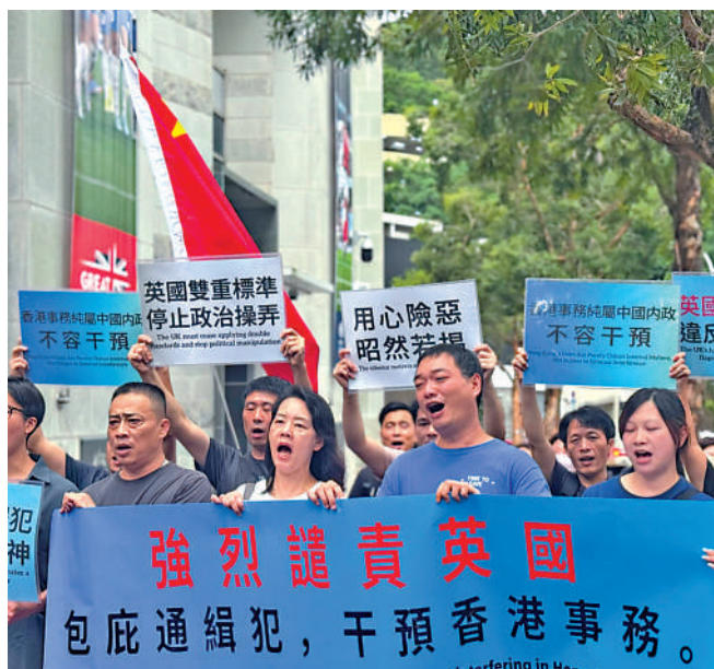
多個團體昨日分別到英國和澳洲駐港領事館抗議，強烈譴責兩國政府包庇兩名香港通緝犯，干預香港內部事務。