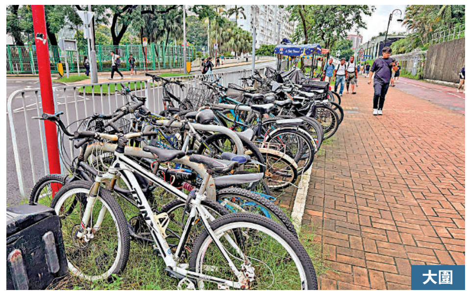
▲積濶里出租單車店的單車長期霸佔公共泊單車位。

警方早前接獲政府物流署舉報，指疑有服務供應商在政府飲用水招標程序中提交虛假陳述文件，詎稱所供應的飲用水由內地一間特定公司生產，惟相關部門其後接獲該生產公司澄清未曾向該中標的供應商供應飲用水。事後，涉案