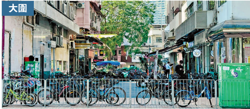
▲積濶里大量出租單車阻塞行人路及公共空間。

在各區單車徑一帶約有5500個單車公眾泊位，惟幾乎所有泊位長期處於爆滿狀態，沙田大圍固然是「重災區」，將軍澳亦是「單車成災」，港鐵寶琳站對出停放處約150個泊位全滿，很多都是嚴重生鏽且被鐵鏈鎖住的「死車」。另