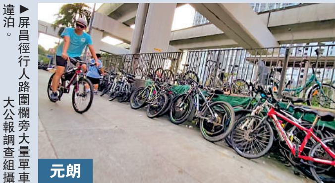
▲新運路大量單車堆放在「不准踏單車」的行人路上。