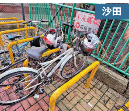
▲瀝源邨不少單車泊位被「死車」長期佔用。

食物環境衛生署回覆大公報表示，接獲違泊個案後，會轉介分區民政處，以便聯合行動處理。地政總署發言人表示，在聯合行動前不少於兩日，會依《土地(雜項條文)條例》(第28章)在單車及適當地方張貼通知，要求有關人士指定日期前移走單車，否則將被移除。