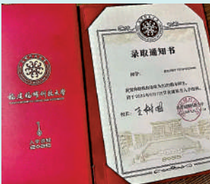
▲小喬的福耀科技大學錄取通知書。

未來，屬於這些敢於追夢、理性選擇、本領過硬的年輕人，也屬於那些勇於創新、特色鮮明、致力育才的新型大學力量。中國教育的多元化圖景，正徐徐展開。