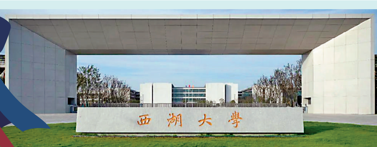
▲西湖大學的優勢在於高起點、小而精、研究型的辦學定位和令人羨慕的生師比，以及本科生導師制、本博貫通培養等施教政策。

從就業市場反饋看，不少企業和機構已將能力和潛力置於學歷之前，更看重學生的創新精神與獨立思考能力。西湖大學等新銳力量，正以其獨特的「小而精」科研教育新範式，悄然改變着高等教育的格局。當然，傳統名校的歷史底蘊和綜合實力依然雄厚，新興高校的價值最終仍需時間和成果來檢驗。