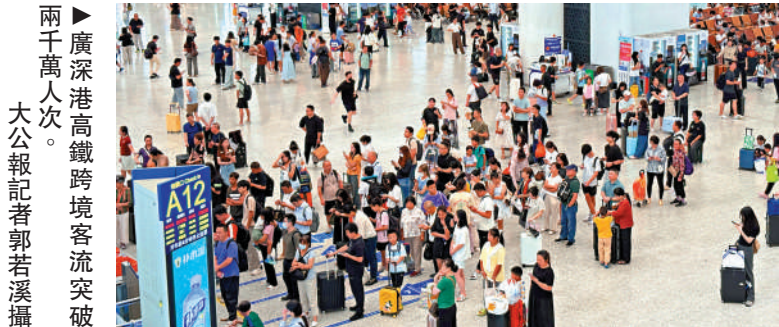
廣深港高鐵跨境客流突破兩千萬人次。

【大公報訊】記者郭若溪深圳報道：隨着粵港澳大灣區建設縱深推進，廣深港高鐵作為區域互聯互通的「黃金動脈」，持續釋放發展活力。記者從深圳鐵路部門獲悉，截至2025年8月21日，廣深港高鐵今年已累計運送跨境客流達2008.8萬人次，同比增長16.2%；其中暑運期間（7月1日至8月21日）運送客流達503.9萬人次，同比增長15.9%，日均運送旅客近10萬人次，區域要素流動呈