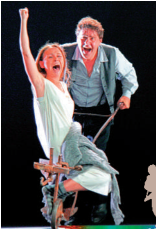
▲《茶花女》劇照。 ▶《紅頭巾》劇照。 ◀《萬尼亞舅舅》劇照。