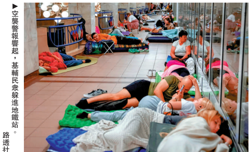
▲空襲警報響起，基輔民眾躲進地鐵站。