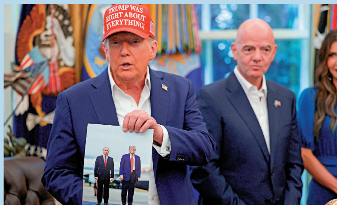
▶特朗普向白宮現場媒體展示一張他與普京在阿拉斯加會晤時的合影。

美國總統特朗普22日表示，要安排俄羅斯總統普京與烏克蘭總統澤連斯基會晤，就像讓「油和醋融合」一樣困難。他還稱，如果兩周內看不到關於結束俄烏衝突的進展，美國或將對俄羅斯進行「大規模制裁」。美聯社稱，俄烏總統會晤受阻對特朗普來說是一次「沉重的挫折」，他一直吹捧自己的外交攻勢將力促俄烏達成和平協議，但「普特會」結束一周了，由於俄烏雙方在關鍵議題上存在明顯分歧，短期內很難推動俄烏停火顯現實質進展。