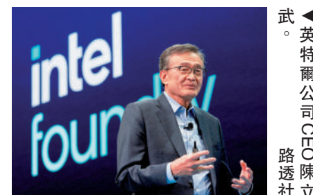
▲英特爾公司CEO陳立武。

美國政府廣泛干預企業事務，引發一些批評人士擔憂，他們認為特朗普此舉會製造新的企業風險。但部分行業分析師稱，目前英特爾每月虧損約10億美元，急需政府或其他財務上更穩健的合作夥伴支持。