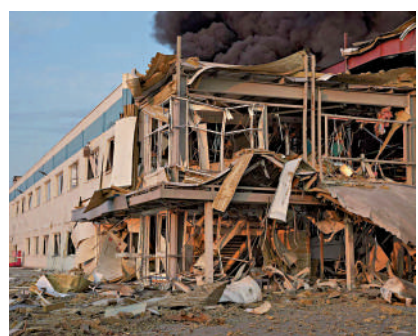
▲烏克蘭外喀爾巴阡州的一棟建築遭俄軍空襲。

澤連斯基指責俄方「百般阻撓」俄烏總統會晤，不想結束戰爭，反而繼續向烏克蘭發動大規模襲擊。他認為，若普京拒絕與其會談，期盼美國作出「強硬回應」，加碼制裁俄羅斯。