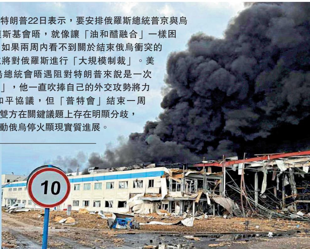
▶烏克蘭外喀爾巴阡州的一間美國工廠遭俄軍空襲，冒出黑色濃煙。

美國總統特朗普22日表示，要安排俄羅斯總統普京與烏克蘭總統澤連斯基會晤，就像讓「油和醋融合」一樣困難。他還稱，如果兩周內看不到關於結束俄烏衝突的進展，美國或將對俄羅斯進行「大規模制裁」。美聯社稱，俄烏總統會晤受阻對特朗普來說是一次「沉重的挫折」，他一直吹捧自己的外交攻勢將力促俄烏達成和平協議，但「普特會」結束一周了，由於俄烏雙方在關鍵議題上存在明顯分歧，短期內很難推動俄烏停火顯現實質進展。