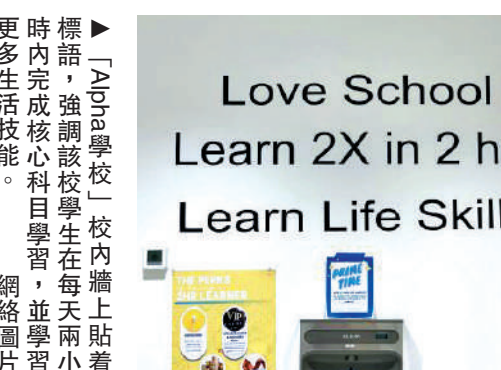
更多時標：「Alpha學校」校內牆上貼著生活技能。該校學生在每天兩小時內完成核心科目學習，並學習小

「Alpha學校」於2014年在得州成立，主推不同傳統的教育模式。該校近兩年引入「AI導師」，號稱幫助學生每天僅用兩小時就完成核心科目學習，AI系統會即