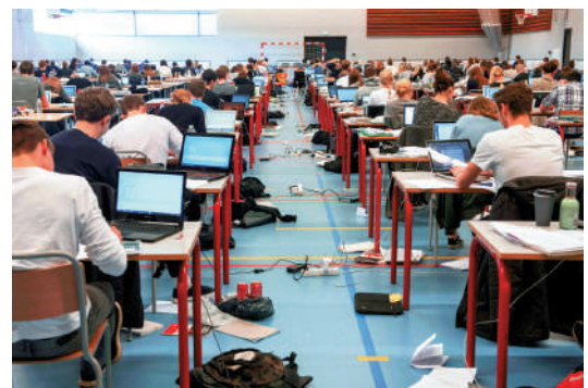
▲丹麥學生明年準備英語口試時可使用AI。網絡圖片

丹麥政府此舉被視為教育體系向數碼轉型中的新嘗試，部分教育工作者認為這將是一個重要突破。不過，也有批評聲音指，這會加劇學生對這類工具的過度依賴，影響學生的自主思考能力。