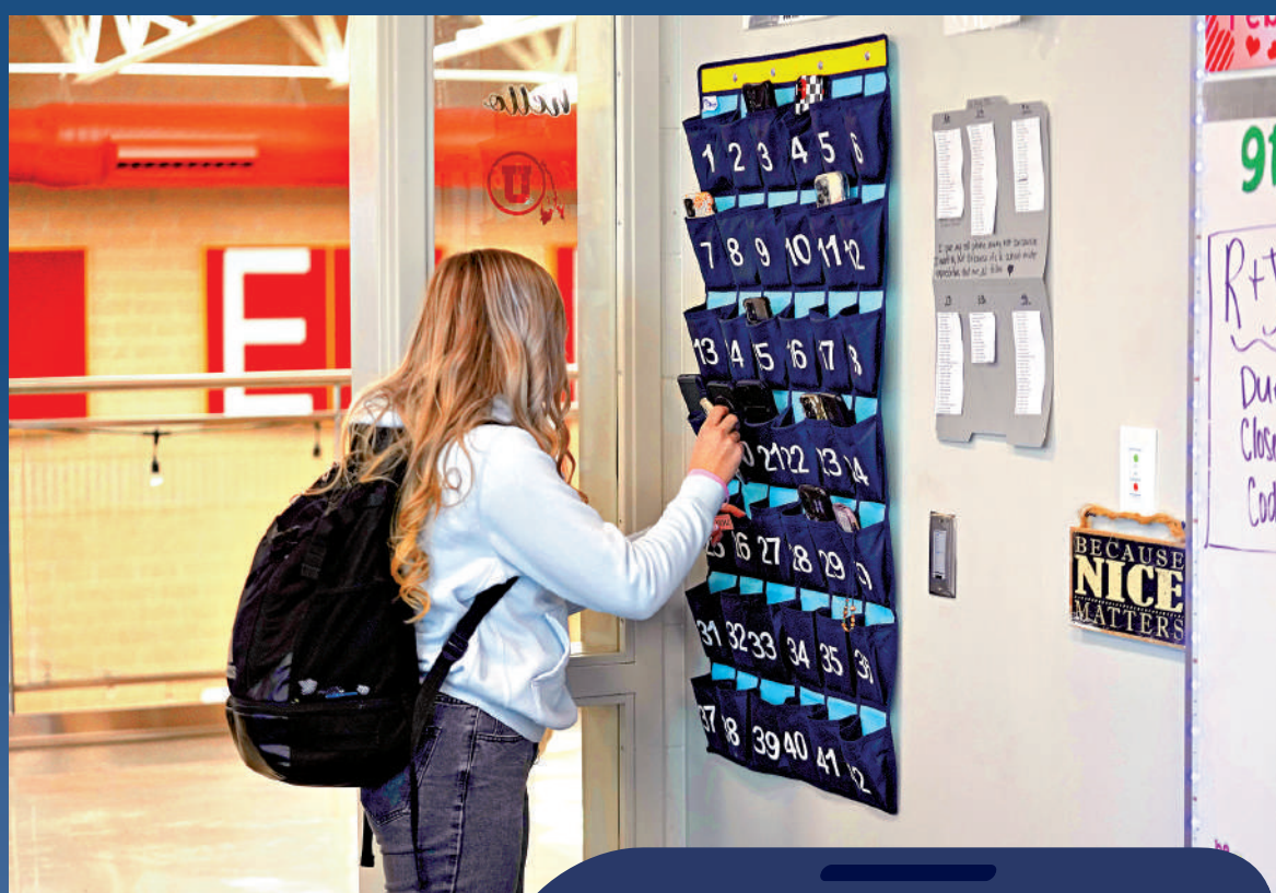
▲美國猶他州一名九年級學生在進入課堂前，將手機放進手機袋中。