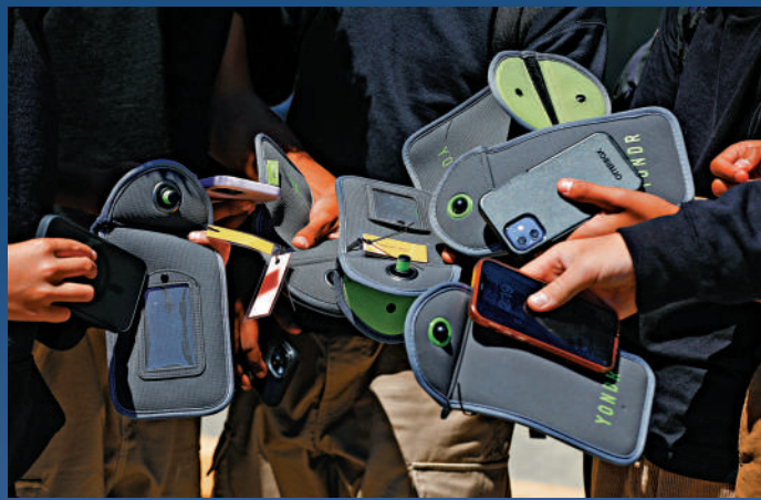
▲加州一所學校使用特製的磁卸手機袋，學生上課前須將手機放入袋內。

隨著智能手機普及，學生沉迷手機，成為老師和家長的普遍困擾之一。美國中小學的秋季新學年從八月起陸續開始，據美媒22日報導，從新學年開始，美國有17個州和華盛頓哥倫比亞特區正式實施有關學生使用手機的新限制，使得美國校園手機禁令覆蓋範圍擴大至35個州，相當於涵蓋全美70%的州。有分析認為，此趨勢代表校園內禁止使用手機，越發成為教育界的共識。