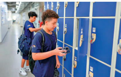
▲巴西聖保羅一所學校的學生在進入課堂前將手機放入儲物櫃。

巴西 ● 從今年2月春季新學期開始，限制全國公立幼兒園到高中學生在校內使用手機，學生進入教室上課之前，必須把手機放進盒子或者儲物櫃裏。大公報整理