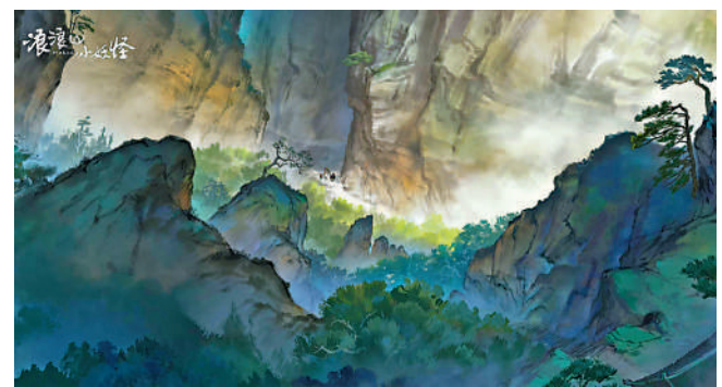
◀動畫中四位小妖怪組成「草根版」西遊四人。