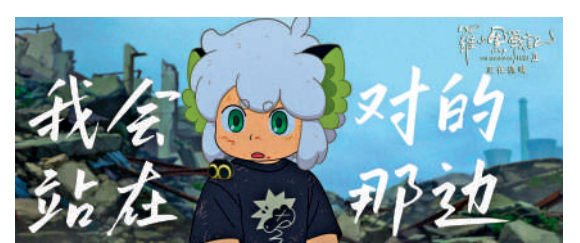
▲動畫對「人妖殊途」進行探討。

「羅小黑」是一隻小貓妖，生活在與人共處的世界。《羅小黑2》一開場，妖精的會館就被人類部隊突襲，館長不幸遇難，證據指向了羅小黑的師父、處於妖族「掌門」地位的「無限」。電影情節雙線並行。妖精一族開會，無限就被「哪吒」軟禁起來；無限的女徒弟「鹿野」則帶着師弟羅小黑調查案件真相，推理、打鬥、移步換景都用公路片的方式展開。