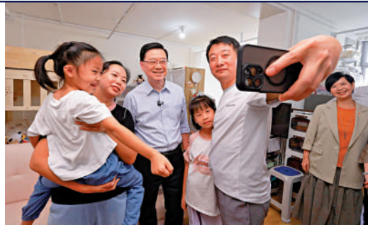
◀李家超昨日到觀塘視察簡約公屋，與新獲編配單位的住戶一同參觀新居。