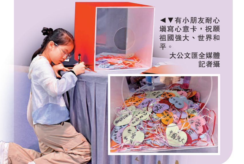
▲有小朋友耐心填寫心意卡，祝願祖國強大、世界和平。