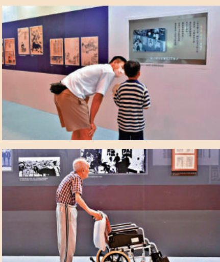
▲不少長者參觀展覽，了解東江縱隊港九獨立大隊的抗日事跡。