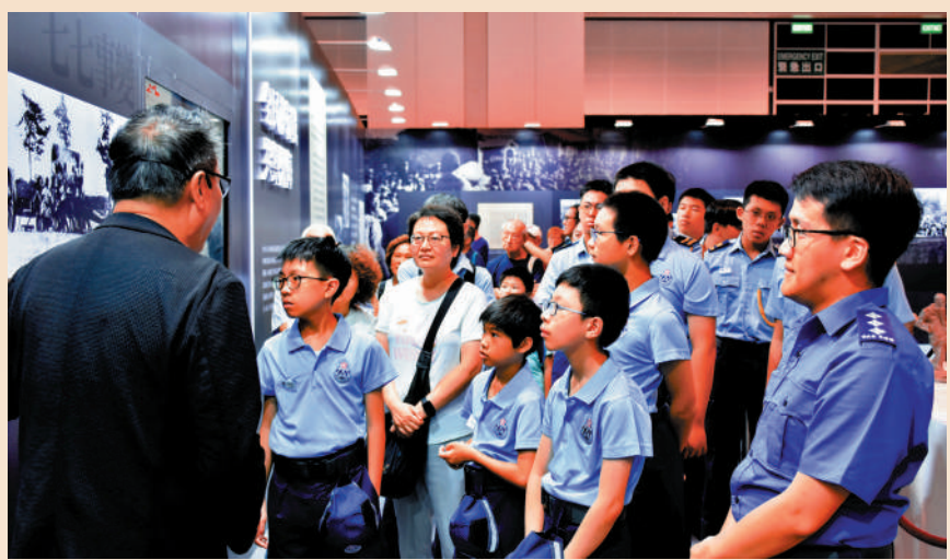
▲民安隊少年團參觀展覽，學習香港抗戰歷史。