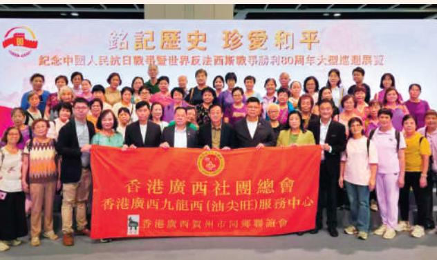
▲香港廣西賀州市同鄉聯誼會一行參觀展覽。