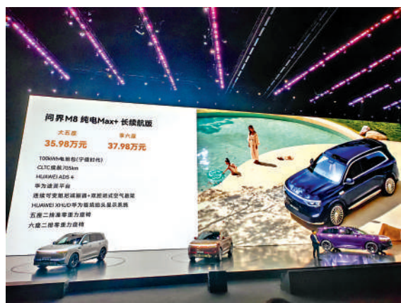
▲問界M8純電版售價35.98萬元人民幣起。

據介紹，智界R7與智界新S7新增後向高精度固態激光雷達和4D毫米波雷達，搭載最新HUAWEI ADS 4，銷售對