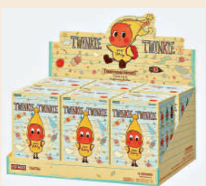
▲在二手平台，新星星人整盒的價格被炒高至1450元人民幣。

正式發售前，二手平台上單隻售價就已接近原價2倍，整盒約1000元 (人民幣，下同)。搶購潮後，二手市場價格持續攀升。潮玩二手交易平台「千島」顯示，新星星人整盒原價474元，目前已被炒高2倍至1450元；