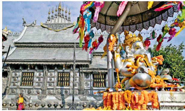
▲遊客參觀位於泰國北部清邁市的素攀寺。

泰國官方數據顯示，截至8月17日，2025年泰國共接待外國遊客2080萬人次，較去年同期下降7%。除免費機票計劃外，泰國政府近期還推出一系列吸引國際遊客的措施，包括延長部分國家的遊客免簽政策、推出面向遠程工作者的數字遊民簽證等。