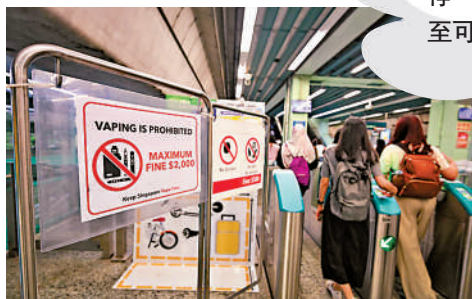
▲新加坡地鐵站有關禁止攜帶電子煙的標示。

●依托咪酯對大腦和神經系統的危害大，吸食後可能會出現頭暈、站立不穩、言語含糊以及手部震顫等，甚至會全身抽搐、身體不受控等類似「喪屍」的狀態。此外，吸食依托咪酯還容易引起呼吸暫停，長期大量使用甚至可能致命。