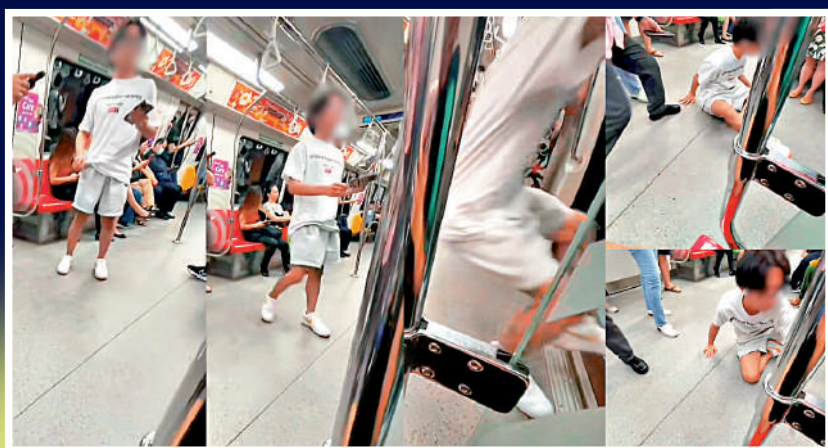
▲一些人在新加坡地鐵和社區內疑因吸食「喪屍煙彈」，重心不穩直接跌倒。