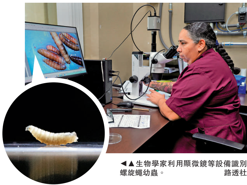
▲生物學家利用顯微鏡等設備識別螺旋蠅幼蟲。

專家表示，這類新型毒品以電子煙的形式銷售，再加上「Kpods」或「太空油」的別稱，很容易蒙蔽年輕人，讓他們誤以為此種產品無害。新加坡國立大學公共衛生學院助理教授范德艾克表示，有關電子煙的錯誤信息十分普遍，當局及社會需要教導年輕人如何辨別這些具有誤導性的信息。(綜合報道)