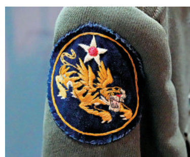
▲克爾的軍服上有「飛虎隊」臂章。「飛虎隊」是二戰期間在中國作戰的美國援華航空志願隊的綽號。