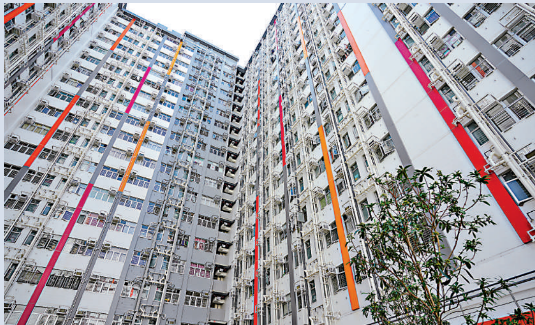
▲彩興路簡約屋項目，第一座18層高大樓用了不足一年半時間，便完成地基到上蓋工程。