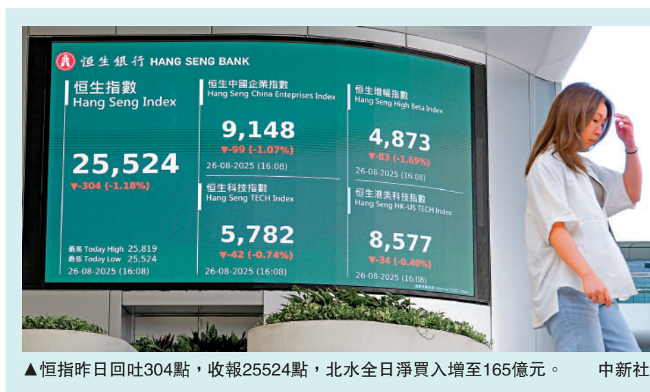
▲恒指昨日回吐304點，收報25524點，北水全日淨買入增至165億元。