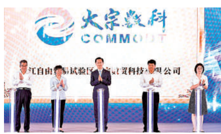
▲以數字化引領航運貿易新格局的大宗數科在舟山正式揭牌。

「經過5年的不斷開發，『絲路雲鏈』通過區塊鏈技術整合大宗商品貿易、航運物流、支付結算等全鏈條數