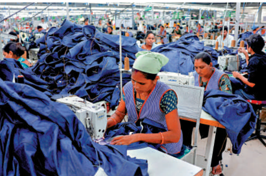
▲ 印度服裝廠等眾多企業面臨美國關稅衝擊。

同時，印度也計劃削減俄羅斯石油進口，對美國作出「適度讓步」。印度向美國出口大量服裝、珠寶等商品，關稅威脅已令很多企業失去訂單，未來充滿不確定性。