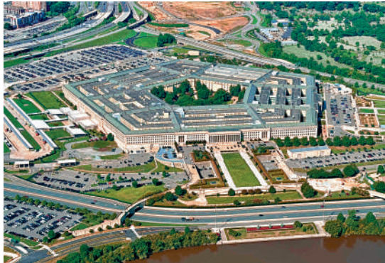
▲ 特朗普有意將美國國防部的名稱恢復為歷史上的舊稱「戰爭部」。

美國於1789年成立「戰爭部」，負責監督陸軍、海軍和海岸陸戰隊的運作與管理。1947年，時任美國總統杜魯門簽署《國家安全法》，將軍事指揮權統一交由新成立的「國家軍事機構」。1948年，美國修訂《國家安全法》，將「國家軍事機構」改稱為「國防部」。