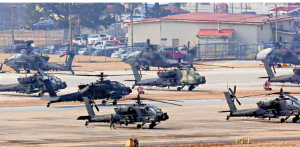
▲ 特朗普盯上駐韓美軍基地的土地所有權。

美韓7月達成貿易協議，韓國承諾在美投資3500億美元，換取美方將對韓關稅從25%降至15%，但兩國對協議細節的解讀有衝突。李在明訪美的主要目的之一是游說美方進一步降低關稅，但並未得到任何承諾。韓方作出更多讓步。韓國產業界宣布將向美國投資1500億美元（約1.17萬億港元），這些投資與貿易協議中的3500億美元投資分屬不同框架。大韓航空將從美國波音公司購買103架飛機、從通用電氣公司採購備用航空發動機，總價值約500億美元，包含在1500億美元投資之內。美韓企業還在造船、核能、能源等領域簽署多項合作協議。