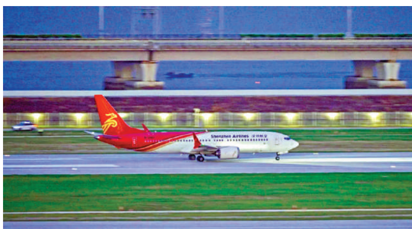
▲26日早，深航波音B737飛機在完成驗證科目後平穩降落在深圳寶安國際機場，深圳機場三跑道真機試飛圓滿成功。

此外，深圳巴士集團還推出「無人駕駛小巴有獎問答」互動活動，通過互動體驗遊戲，讓市民乘客更了解羅湖無人駕駛小巴。來自香港的旅客稱讚道：「無人駕駛技術令人震撼，充分展現了深圳在科技創新應用上的魄力和勇氣。」