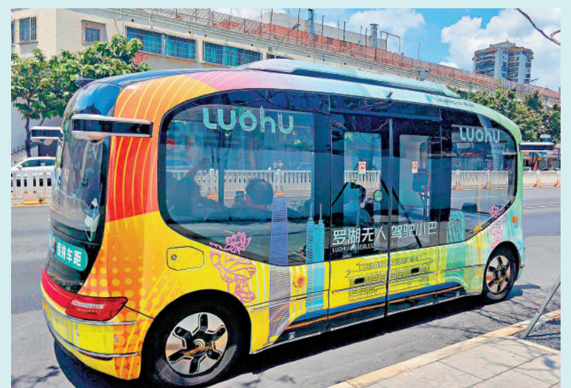
▲在B888線車上，乘客透過全景式側窗能清晰看到窗外風景。

B888線由羅湖區政府、深圳市交通運輸局與深圳巴士集團聯合打造，以羅湖口岸為起點，與崗崗萬象食家雙向對發，是深圳首條中心城區開放道路全時段運營的L4級無人駕駛線路，全程約10.9公里，運行時長約65分鐘。