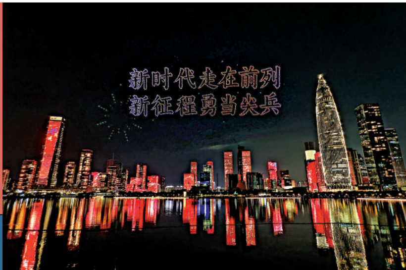
▲26日晚，深圳舉行深圳經濟特區建立45周年無人機燈光秀表演。