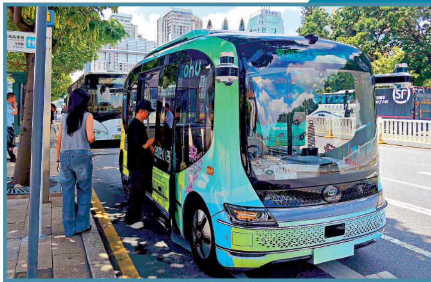
▲深圳羅湖無人駕駛B888線小巴開通試運行，乘客登上無人車。