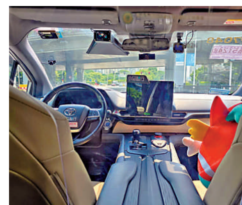
▲自動駕駛出租車將助力全運會。

【大公報訊】記者張銳廣州報道：「香港記者看廣州科技」活動昨午在廣州廣報中心舉行，聚焦科技如何助力第15屆全運會及殘特奧會。活動由廣州賽區執委會指導，廣州日報報業集團與香港體育記者協會聯合策劃，以「智匯灣區，賦能全運」為主題，展示自動駕駛、智能裝備、AI中醫等多項創新技術應用。