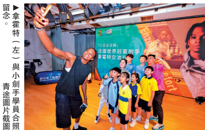
▲拿霍特（左）與小劍手學員合照留念。青途圖片合照