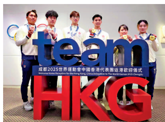
▲6名港隊成員合共獲得3金2銀1銅，取得歷史佳績。