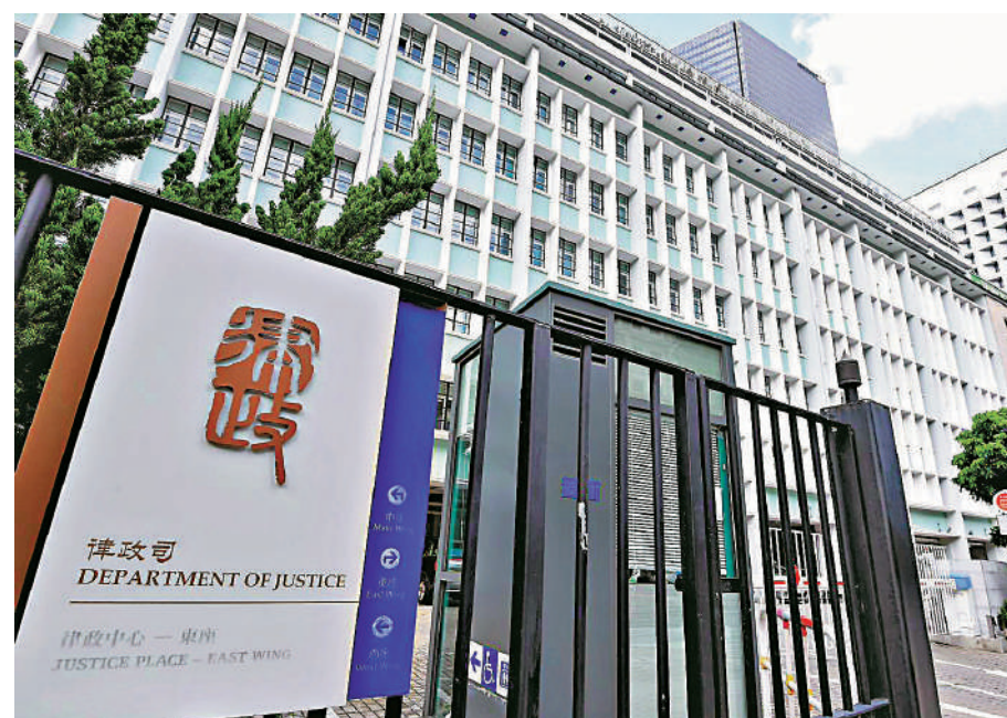
▲律政司主管刑事檢察工作，不受任何干涉。