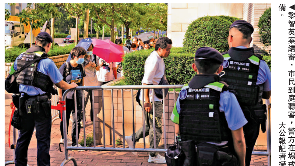
▲黎智英案續審，市民到庭聽審，警方在場戒備。