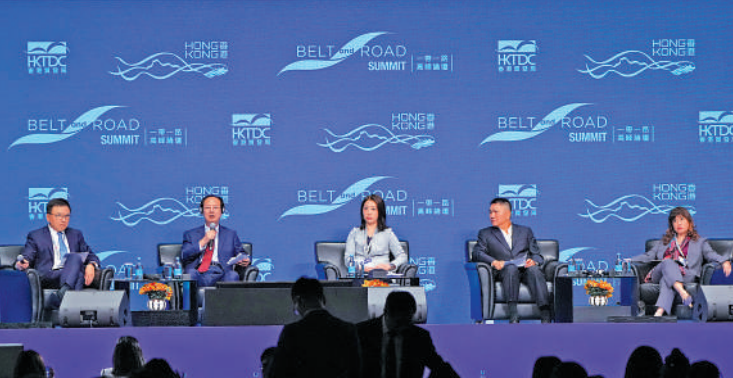
▲去年舉行的第九屆「一帶一路高峰論壇」，首場主論壇以「把握「一帶一路」商機」為主題。

路」沿線及相關國家和地區超過90位主要官員及商界翹楚。丘應樺表示，一如既往，中央部委會派員出席論壇。到目前為止已回覆出席的外國官員講者包括哈薩克和東埔寨副總理、馬來西亞、土耳其、巴基斯坦等部長級官員、亞太經合組織高層，以及商界領袖，反映國際間對香港作為國際樞紐的認可。