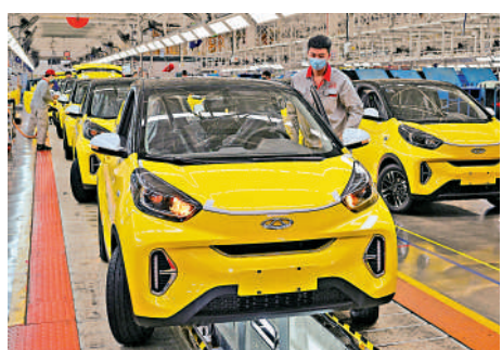
▲去年首9個月，奇瑞新能源汽車收入佔比增至16%。

另外，紫金礦業（02899）旗下所有黃金礦山（除中國之外）整合而成的黃金開採公司紫金黃金國際傳最快9月在港上市，料集資20億美元（約155.7億港元）。該公司在中亞、南美洲、大洋洲和非洲等黃金資源富集區持有8座黃金礦山的權益，2024年黃金產量達46.7噸，2024年收入及股東應佔權益維持增長。