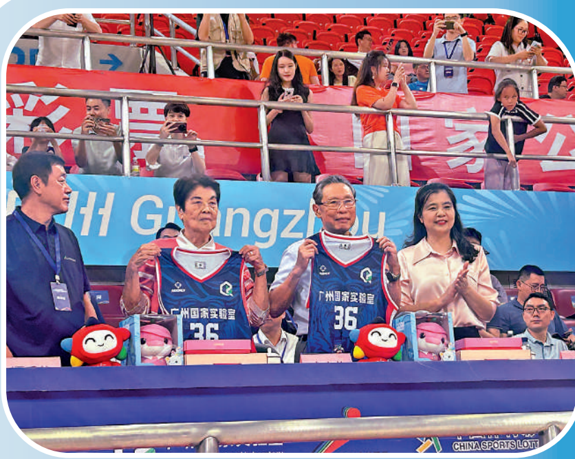
▲在「南山挑戰盃」開幕儀式上，鍾南山（左三）和夫人李少芬（左二）獲贈36號球衣。因為他們都出生於1936年。