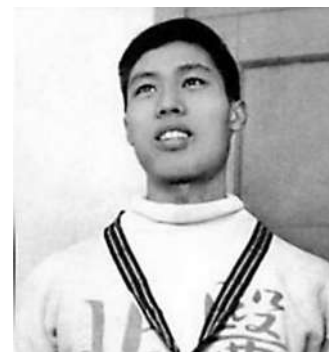
▲鍾南山在首屆全運會曾破400米欄全國紀錄。資料圖片