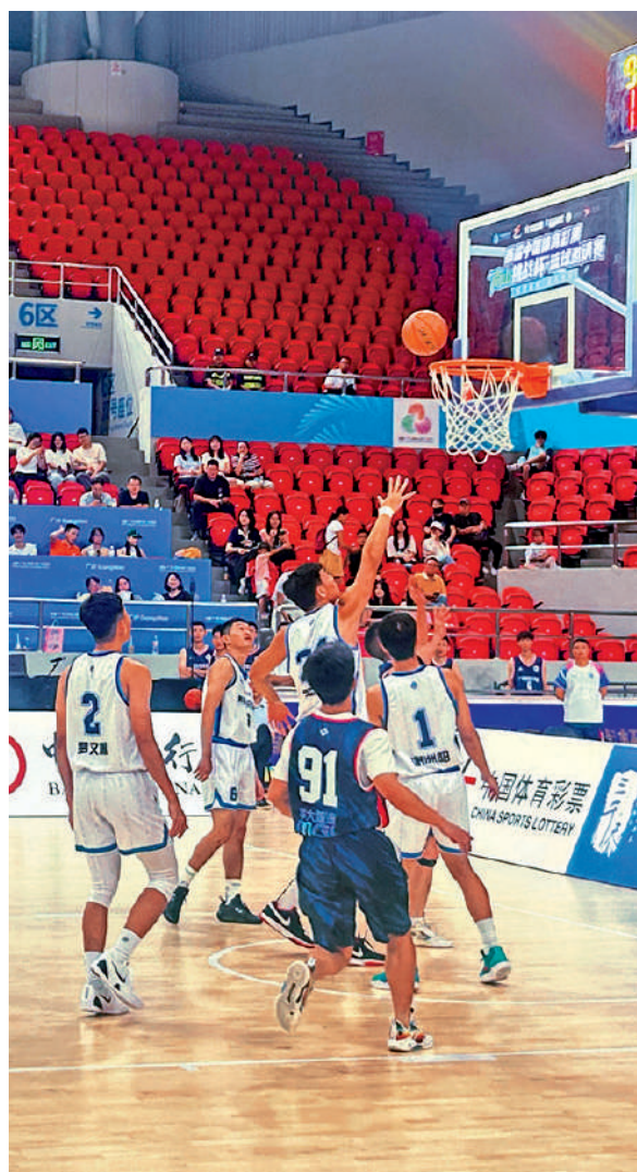
▲「南山挑戰盃」籃球邀請賽在廣州天河體育館開幕，來自粵港澳大灣區的25支籃球隊伍參賽。