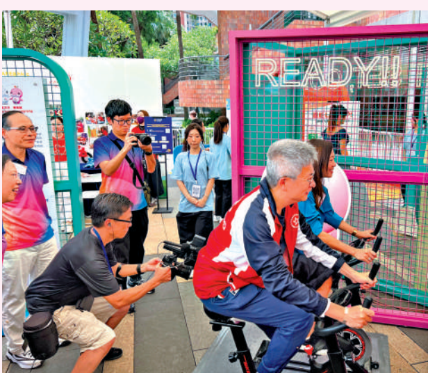
▲活動嘉賓在運動體驗區即場試玩。