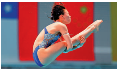
▲陳芋汐勇奪今屆世錦賽女子10米台冠軍。

開幕式活動上，鍾南山在籃球場上步伐矯健，上下台階腳步輕快，在為兩支球隊開球時依然能夠高高躍起，完全看不出是一個快將90歲（鍾南山1936年10月20日出生，現年88歲）的長者。