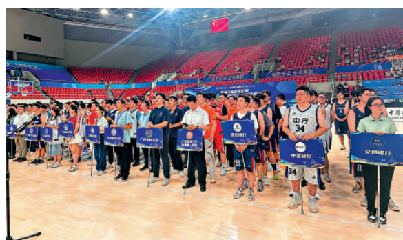
▲「南山挑戰盃」參賽隊伍覆蓋政府單位、科研機構及醫療機構等。

本屆全運會上，鍾南山團隊研發的快速檢測產品，將為賽會提供醫療保障。他指出，當運動員身體不適時，通過快速檢測產品和方法，現場醫療團隊能夠在5-10分鐘內檢測出病原，快速甄別是流感病毒、新冠病毒或是其他病毒，從而進行精準治療和防控。