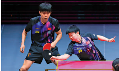
▲王楚欽與孫穎莎是去年巴黎奧運會乒乓球混雙金牌得主。