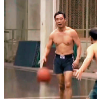
▲鍾南山早幾年仍有參與籃球運動。