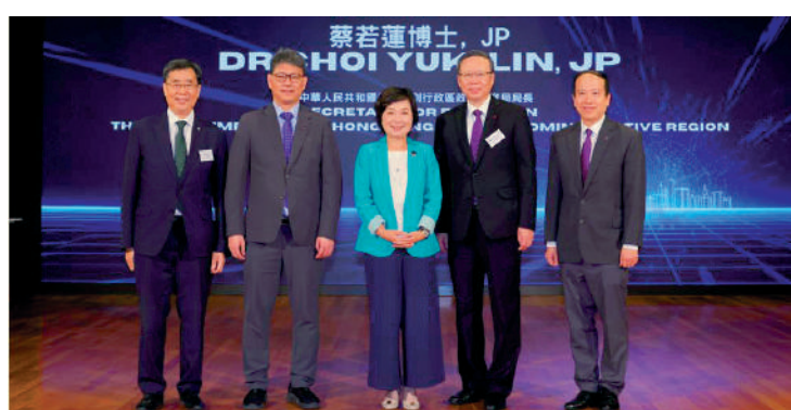
▲理大應用社會科學系舉辦的「點亮社會創新比賽2025」頒獎典禮早前結束。

【大公報訊】記者陳劍報道：香港理工大學（理大）應用社會科學系舉辦的「點亮社會創新比賽2025」早前結束，吸引逾180名來自22所中學的學生參加，比賽採用跨學科方式，結合社會科學領域知識，並運用人工智能、全景攝像技術和混合沉浸式虛擬環境（HIVE）設施等尖端科技，配合一系列培訓工作坊，提升學生對迫切社會議題的認識和關注。