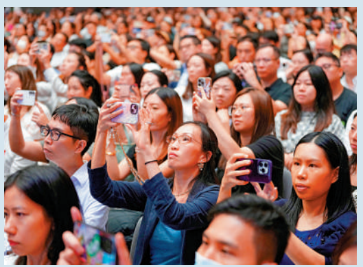
▲家長們不時舉起手機拍攝台上播放的影片。