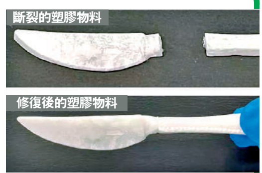
▲新型環保塑膠物料具有「自我修復」功能，若物料表面遇到輕微破損，只要於常溫下在裂縫或刮痕加入少量水，其化學結構能夠重新結合，恢復原來的分子結構及承載能力。

到輕微破損，只要於常溫下在裂縫或刮痕加入少量水，其化學結構能夠重新結合，恢復原來的分子結構及承載能力，過程中不需要額外加熱或經化學處理。對比現時市面流通的「可降解生物塑膠」，例如聚乳酸（PLA）需要在工業級環境才能降解，而且降解後的混合物亦不適宜成為再生原料製成新塑膠袋，團隊研發的新物料真正做到循環再用。