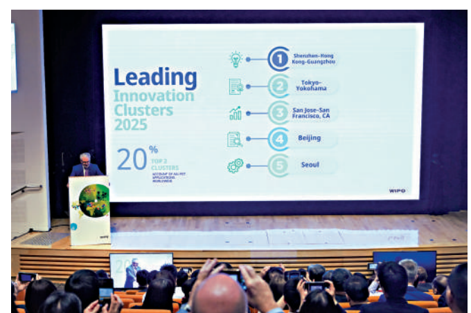
▲世界知識產權組織前日公布《2025年全球創新指數》世界百強創新集群排行榜，「深圳—香港—廣州」集群首次榮登榜首。

香港理工大學亦對今次排名感到十分鼓舞，理大校長滕錦光教授表示，「深圳—香港—廣州」創新集群於全球創新指數中排名第一，充分展現大灣區協同創新的強大動力。理